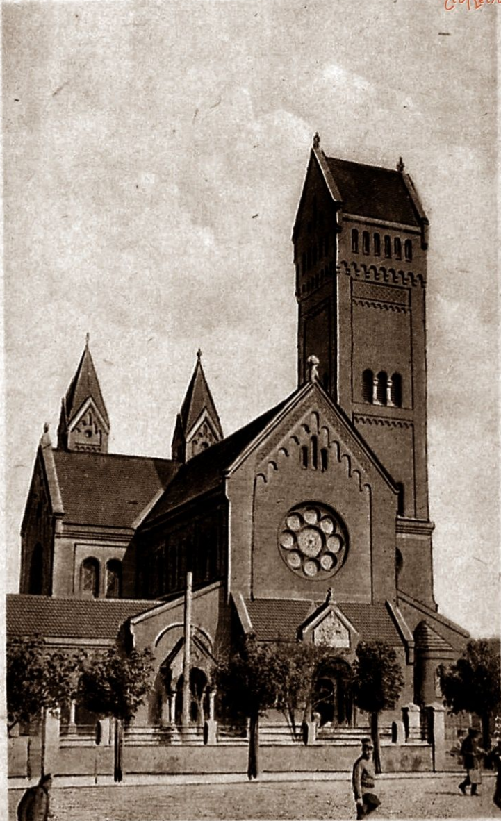
Minsk, Neue Katholische Kirche