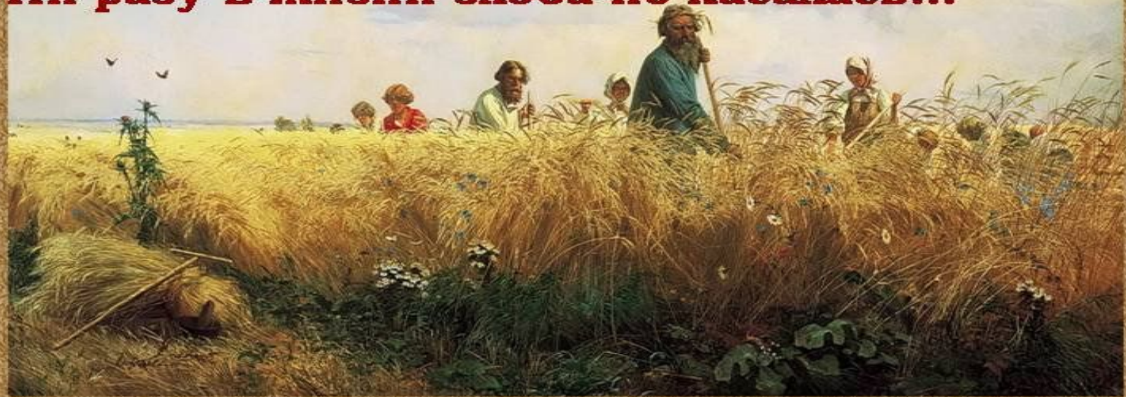
ФИЛЬМ ЭДУАРД АСАДОВ « РОССИЯ НАЧИНАЛАСЬ НЕ С МЕЧА »