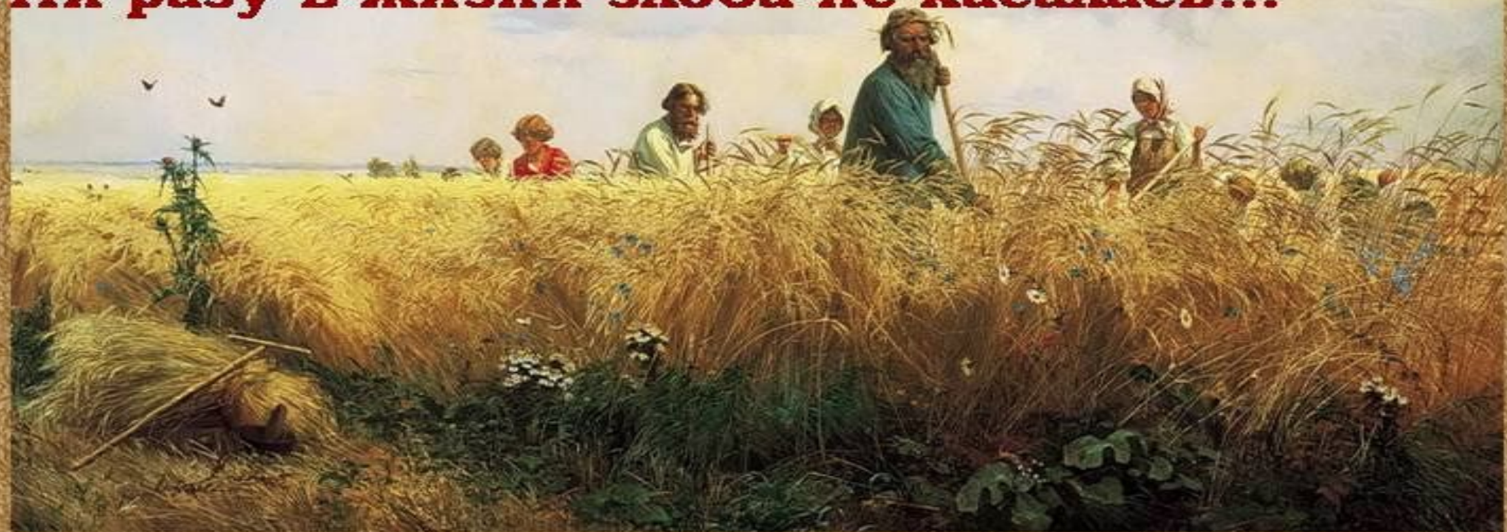
ФИЛЬМ ЭДУАРД АСАДОВ «РОССИЯ НАЧИНАЛАСЬ НЕ С МЕЧА»