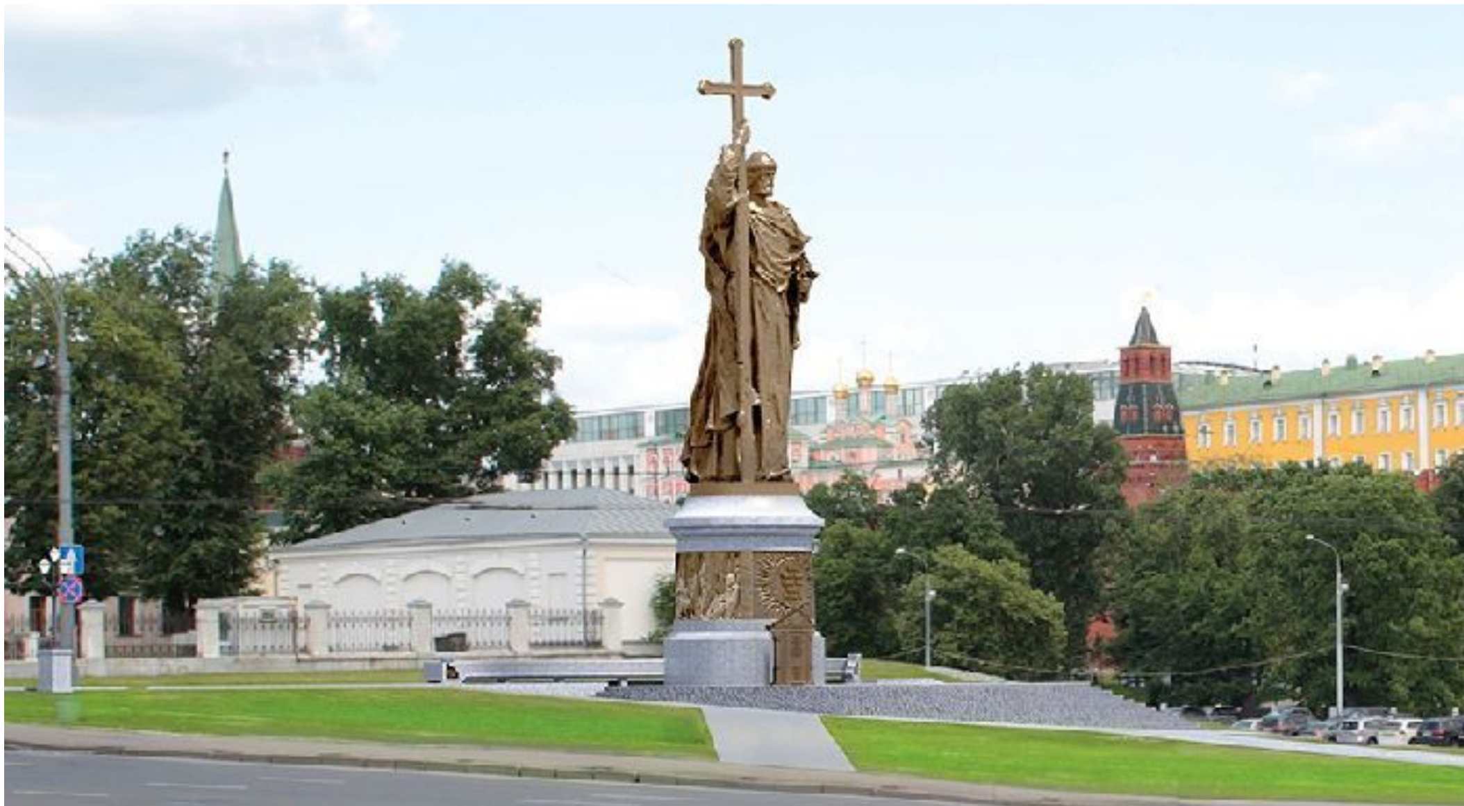
ПАМЯТНИК КНЯЗЮ ВЛАДИМИРУ НА БОРОВИЦКОЙ ПЛОЩАДИ В МОСКВЕ.