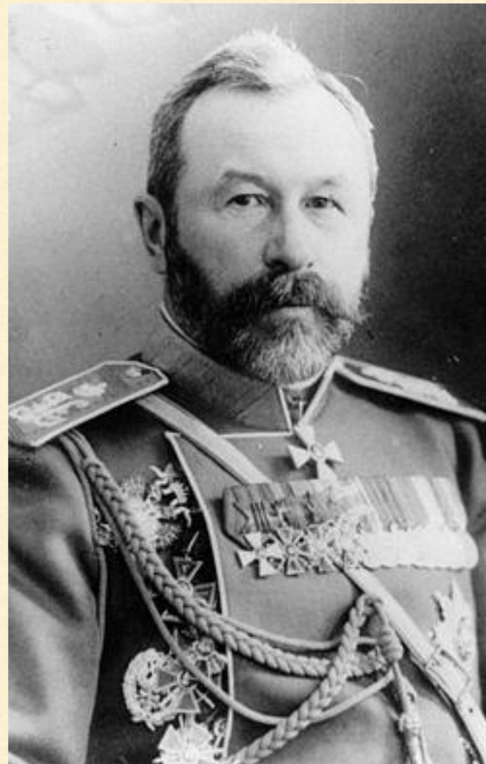
А. Н. Куропаткин

«Важнейшей нашей задачей в начале войны должно служить сосредоточение наших войск. Для достижения этой задачи мы не должны дорожить никакими местными пунктами, никакими стратегическими соображениями, имея в виду главное — не давать противнику возможности одержать победу над нашими разрозненными войсками. Только достаточно усилившись и подготовившись к наступлению, переходить в таковое, обеспечив себе насколько возможно успех».