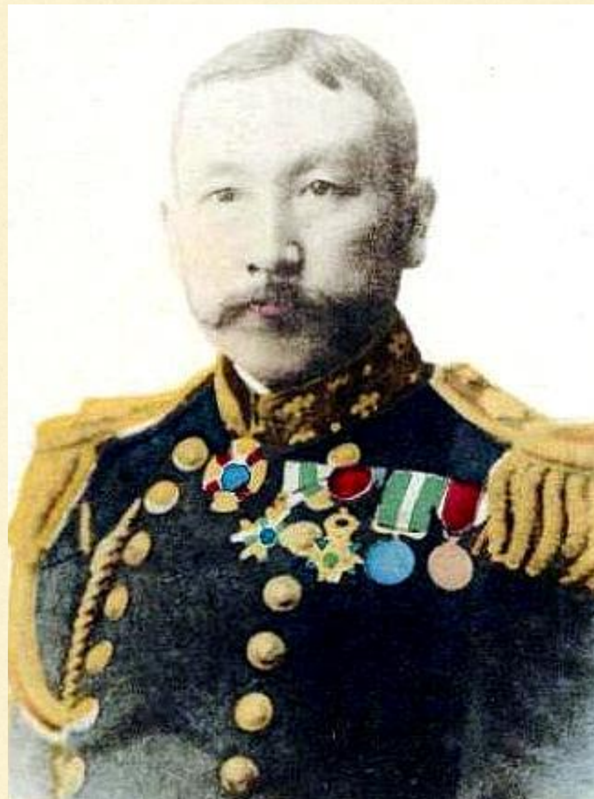
адмирал Уриу Сотокити