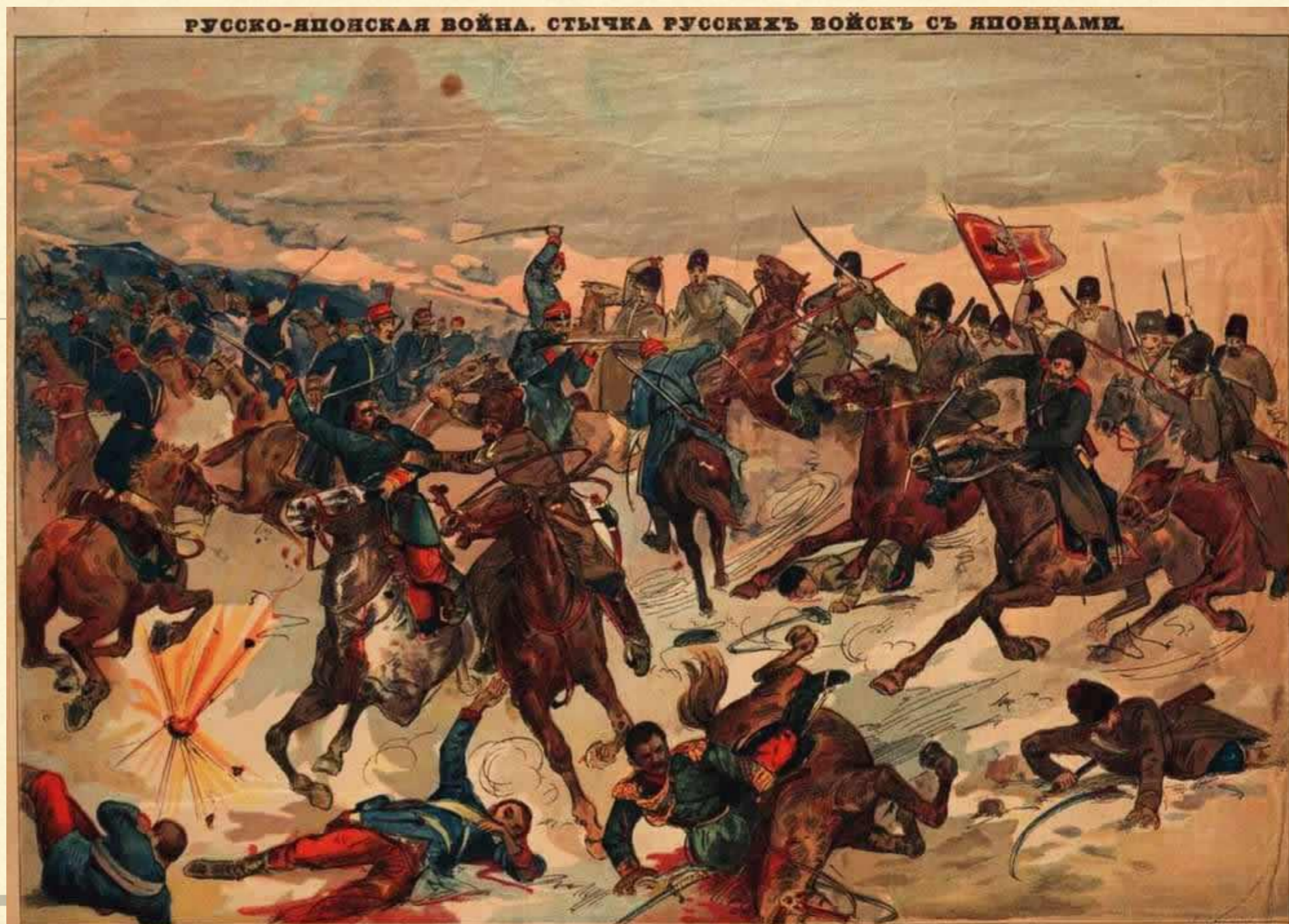
Ляонгь, 16 февраля. Получено донесение, что передовой русский конный отряд проделал из глубь Кореи на 300 верст и имел первое столкновение с передовым японским отрядом, вышедшим из Пенчана. Японцы разбиты. Генералъ Лепеничъ послалъ корпусъ пехоты для усиления нашей конницы и для нашего укрѣпленія въ Сѣверной Корѣ (Росс. Л.).