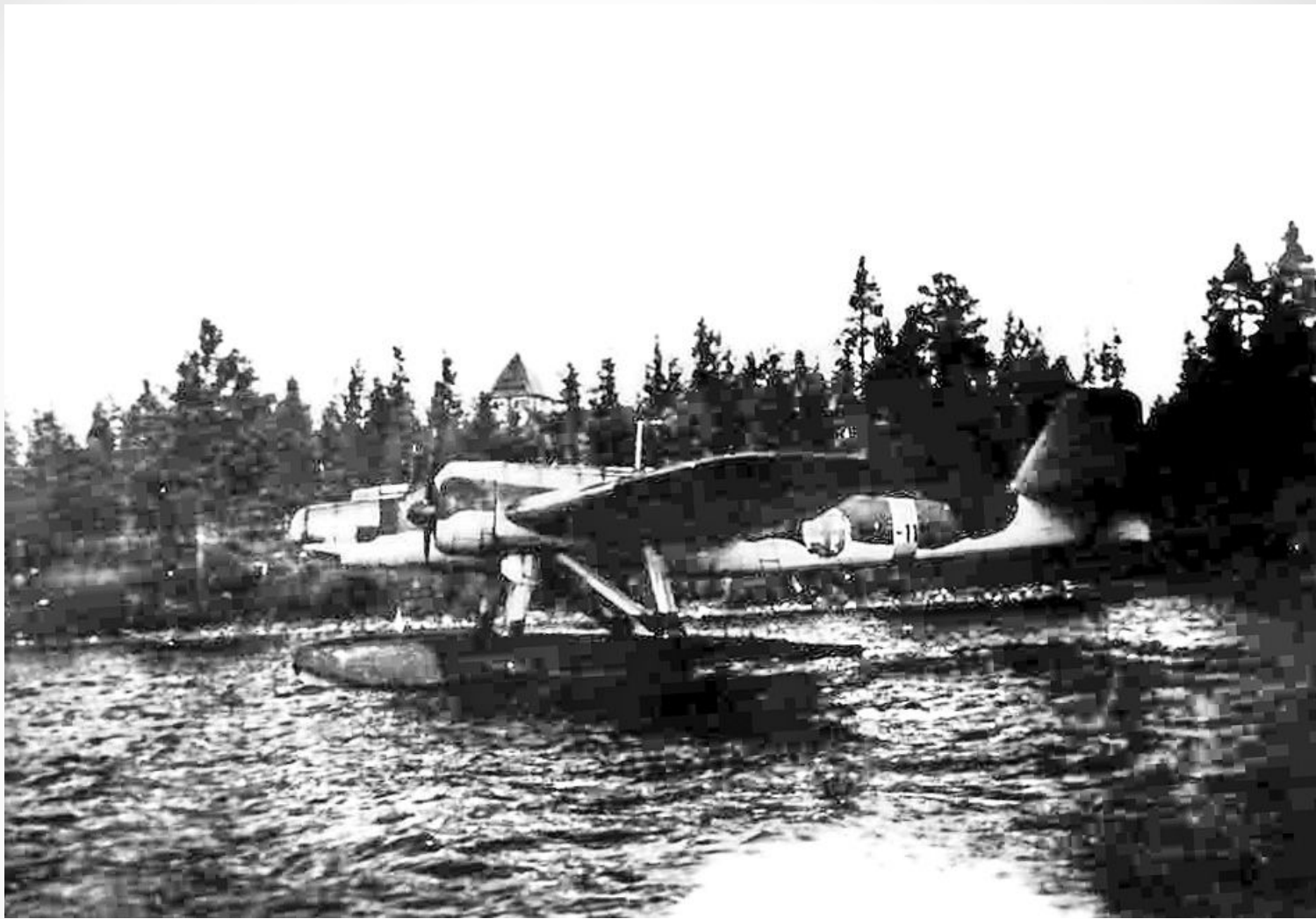
Самолет на оз. Укшезеро (Косалма), откуда финские разведчики разведывательно-диверсионного отряда майора Куйсманена забрасывались в тыл РККА в 1942–1943 гг.