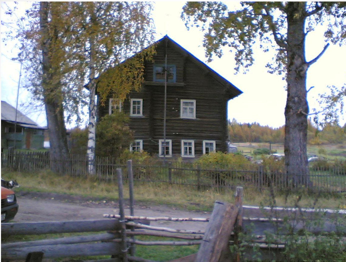
Дом в Уляге, в котором располагалась Петрозаводская разведшкола в 1943 гг.