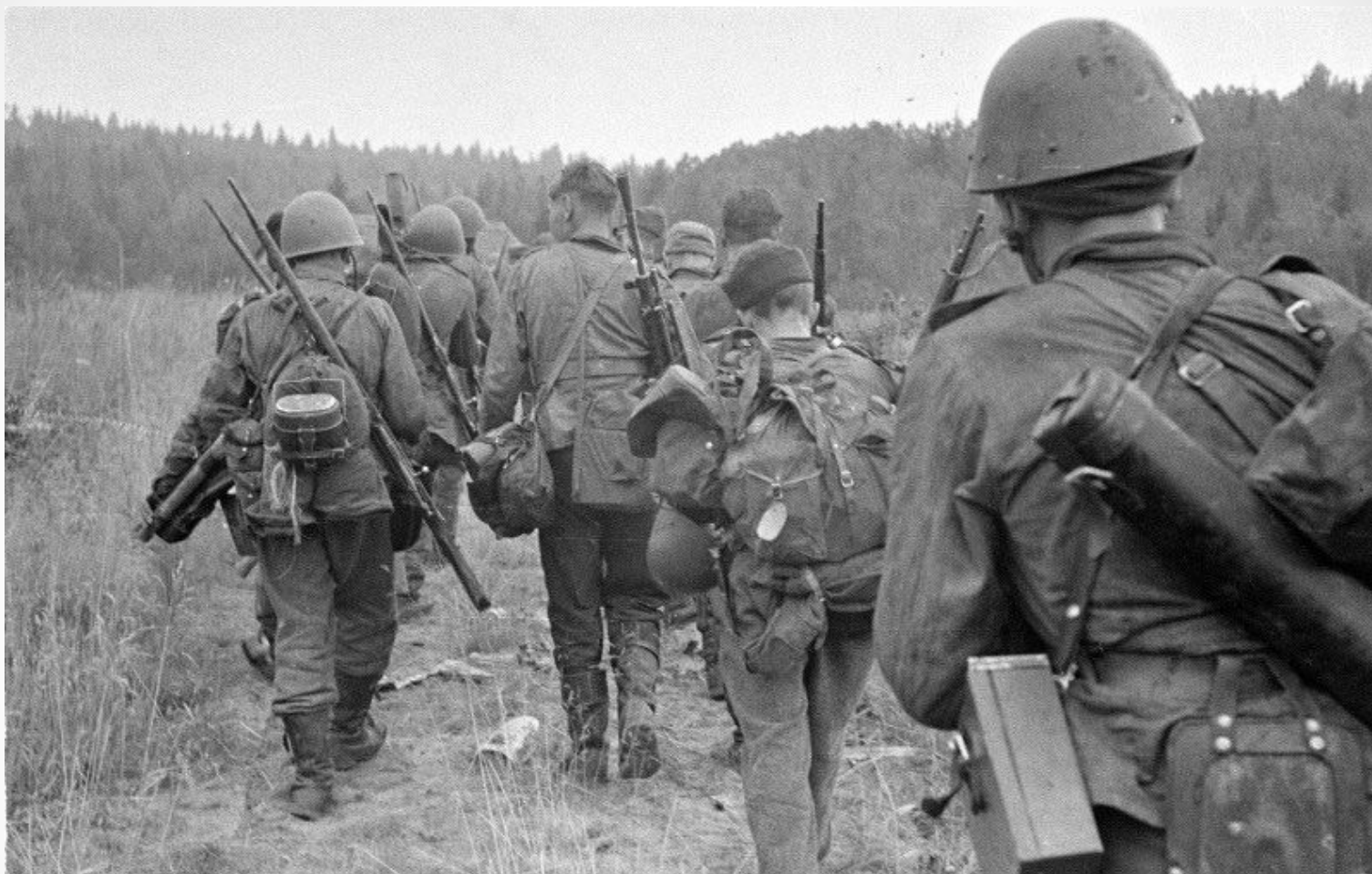
Финский спецназ – дальняя разведка