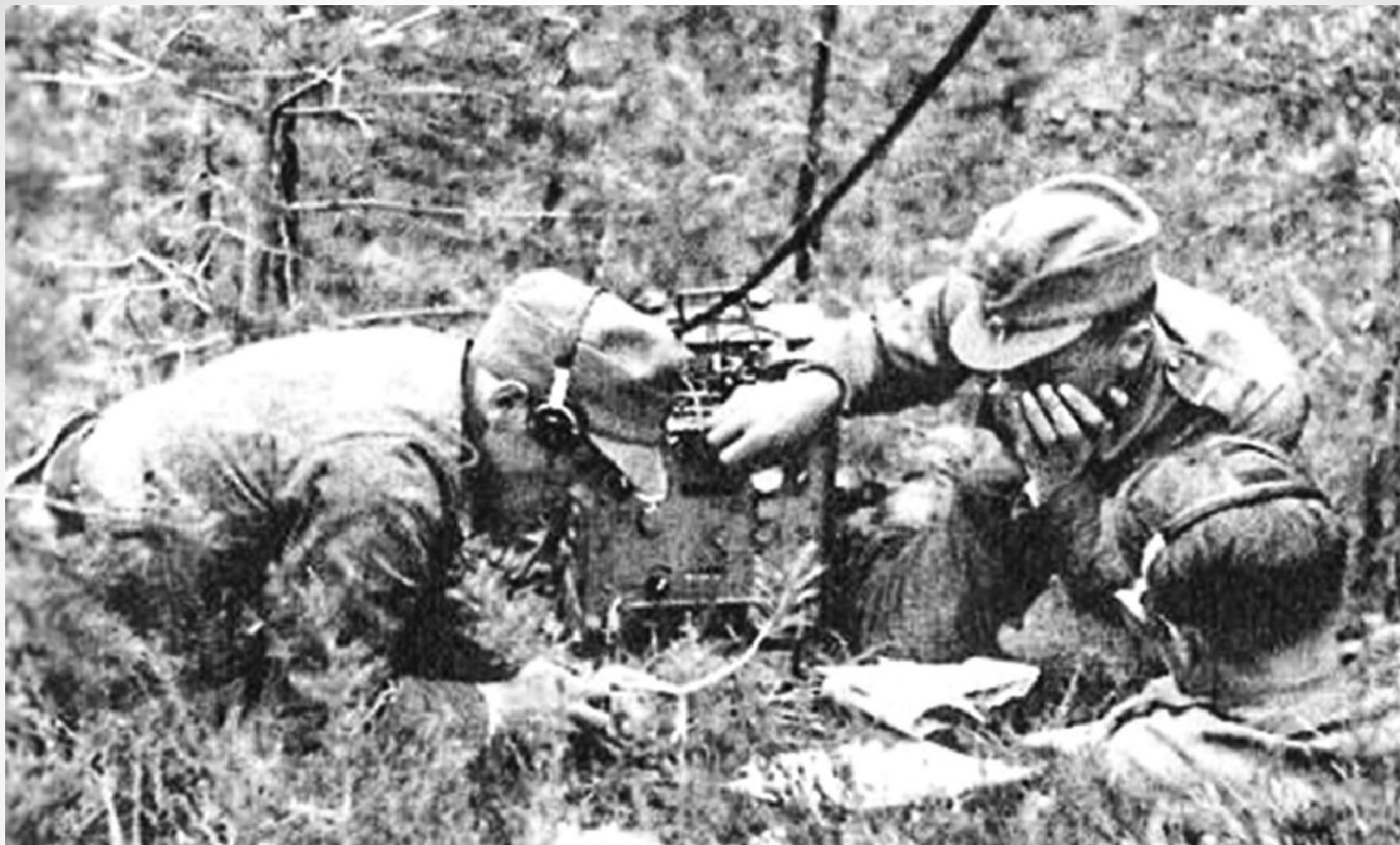
Финская разведгруппа в советском тылу