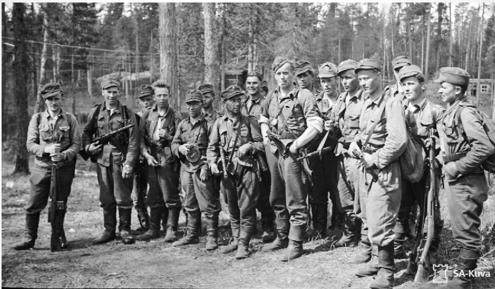
Диверсанты после пяти дней рейда по советскому тылу, Рукаярви, Карелия, 30 мая 1942 г.