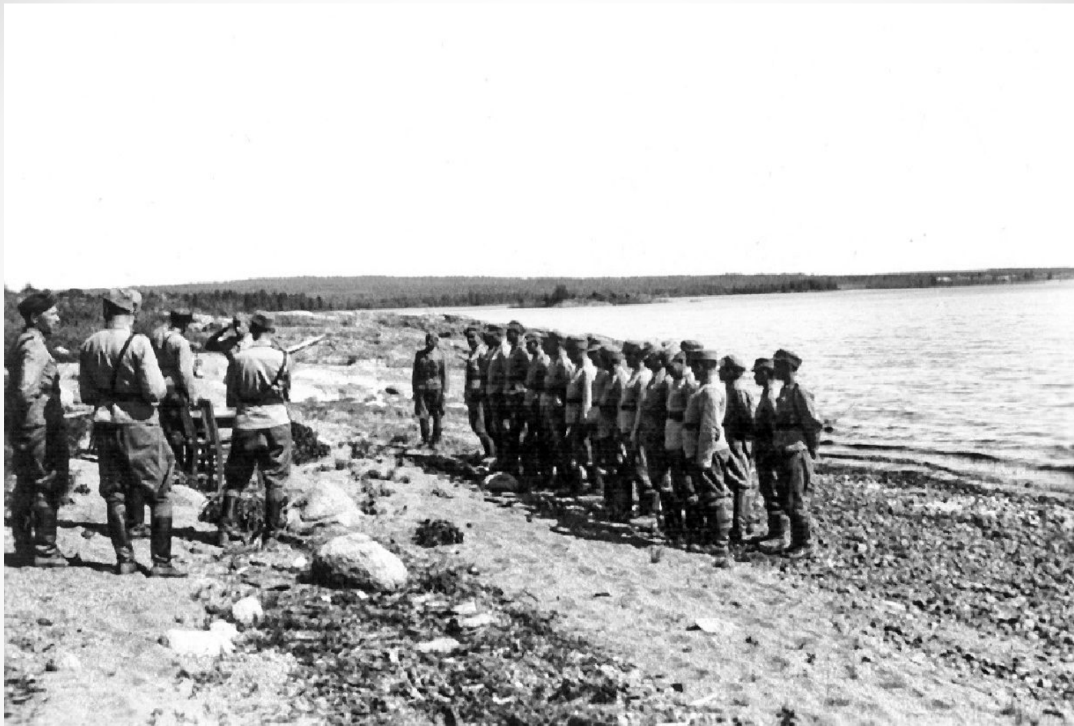
Церемония награждения курсантов Петрозаводской школы финской разведки, 1943 г., берег оз. Шотозеро.