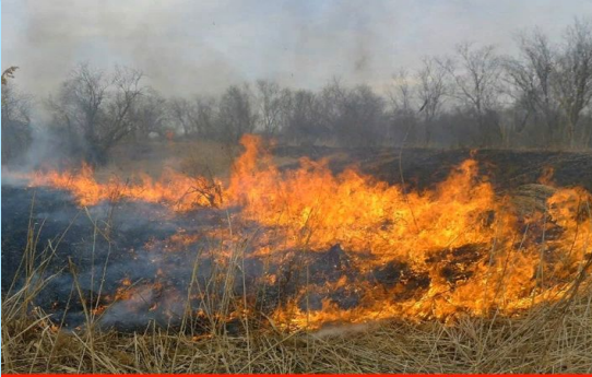
ВОЗГОРАНИЕ СУХОЙ РАСТИТЕЛЬНОСТИ

Прогнозируемые риски. Чрезвычайная пожароопасность (5 класс)