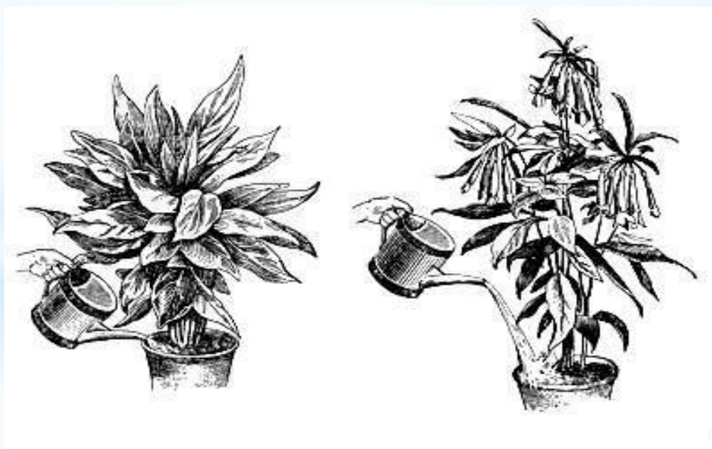
Поливка растений: слева - правильная поливка; справа - неправильная поливка

Когда необходимо предохранить от воды корневую шейку, поливку производят только по краю земляного кома, где находится главная масса молодых корней (например, так поливают цикламен во время цветения).