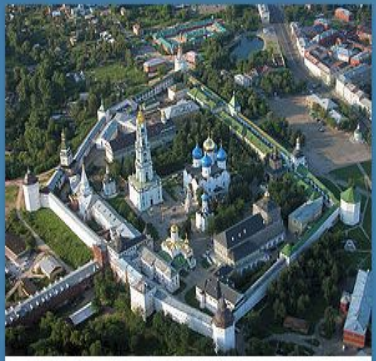
Свято Троицкая Сергиева Л...

ИССЛЕДОВАТЬ ХРАМЫ СЕРГИЕВА ПОСАДА С ПОЗИЦИИ ПАЛОМНИКА. ВЫБРАТЬ НАИБОЛЕЕ ИНТЕРЕСНЫЕ И РАССКАЗАТЬ О НИХ, СОПРОВОДИВ РАССКАЗ ФОТОГРАФИЯМИ.