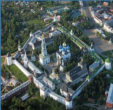
Свято Троицкая Сергиева Л...

ИССЛЕДОВАТЬ ХРАМЫ СЕРГИЕВА ПОСАДА С ПОЗИЦИИ ПАЛОМНИКА. ВЫБРАТЬ НАИБОЛЕЕ ИНТЕРЕСНЫЕ И РАССКАЗАТЬ О НИХ, СОПРОВОДИВ РАССКАЗ ФОТОГРАФИЯМИ.