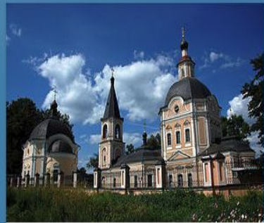
Храм Успения Пресвятой Бо...