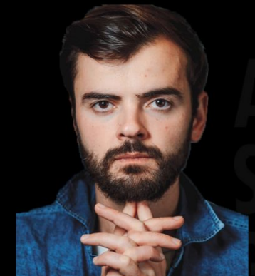
Антон Вячеславович Лапенко – российский актёр театра и кино, videоблогер.