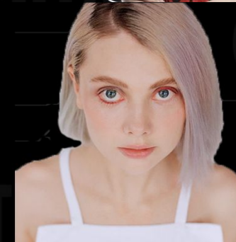
Эллен Шейдлин – российский фотоблогер, художница.