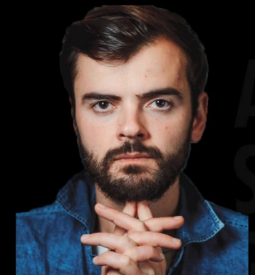
Антон Вячеславович Лапенко – российский актёр театра и кино, videоблогер.