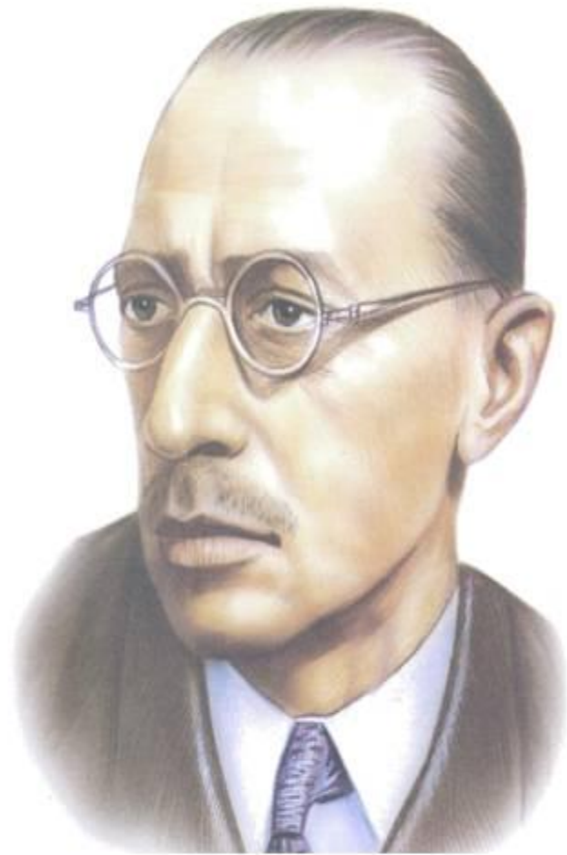
СТРАВИНСКИЙ Игорь Федорович (1882 – 1971)