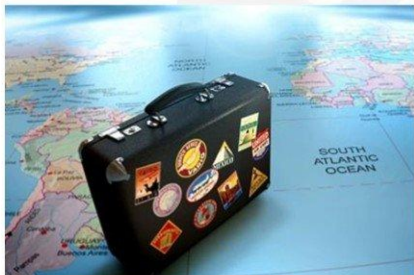
Выезд россиян за рубеж с целью туризма 2013