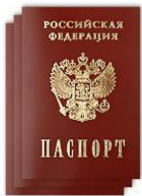
Данные паспорта учредителей и директора