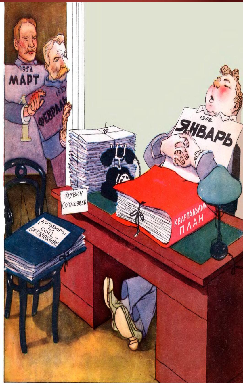
Выполнять план с первых дней нового года. («Правда»)