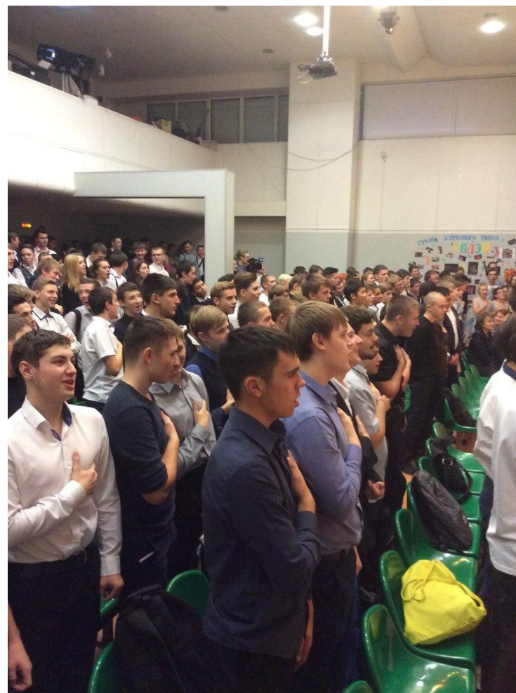
Посвящение в колледже