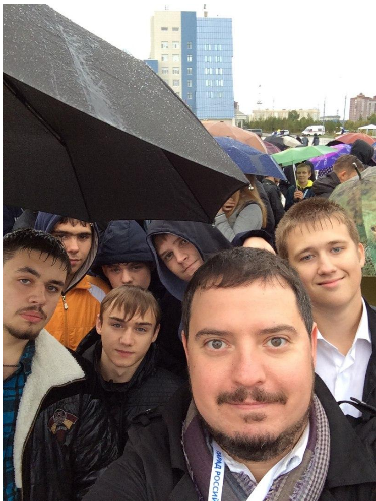
Парад российского студенчества