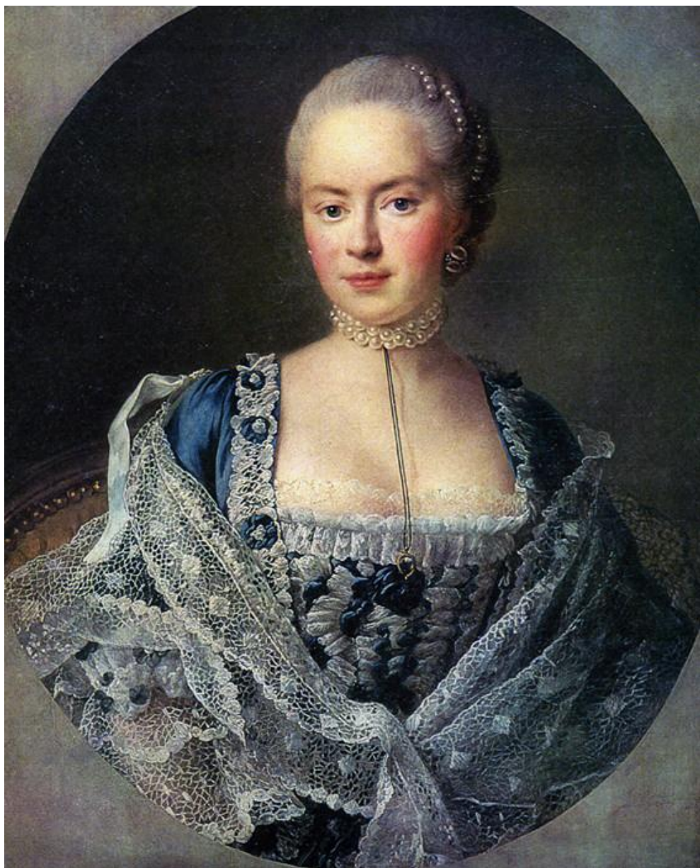
Дарья Николаевна Салтыкова