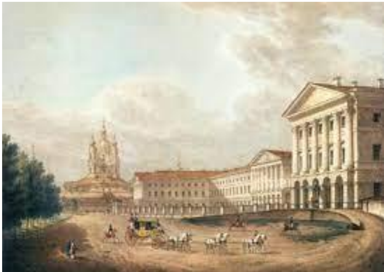
Смольный институт благородных девиц