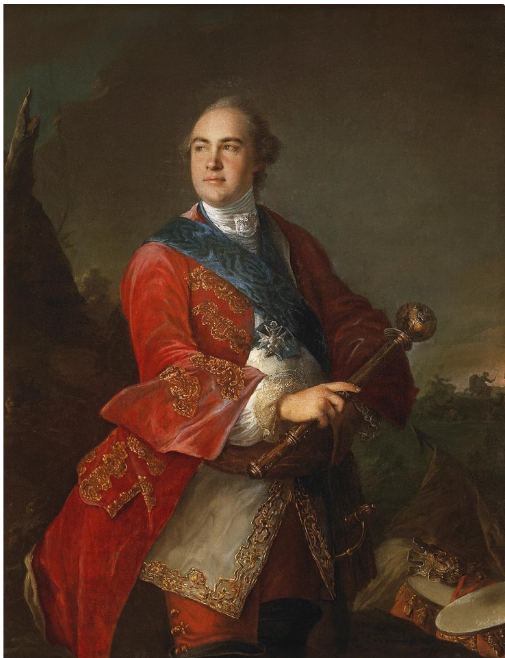
Гетман К. Разумовский