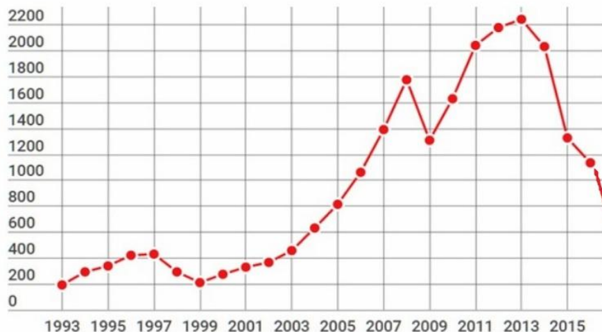
График номинального ВВП России в миллиардах долларов США:

ВВП России указан в текущих ценах 2015 года в миллиардах рублей. Пересчёт ВВП России среднегодовому курсу доллара США к российскому рублю.