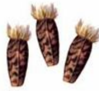
Плоды лопуха (репейника)