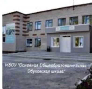
МБОУ "Основная Общеобразовательная Обуховская школа"