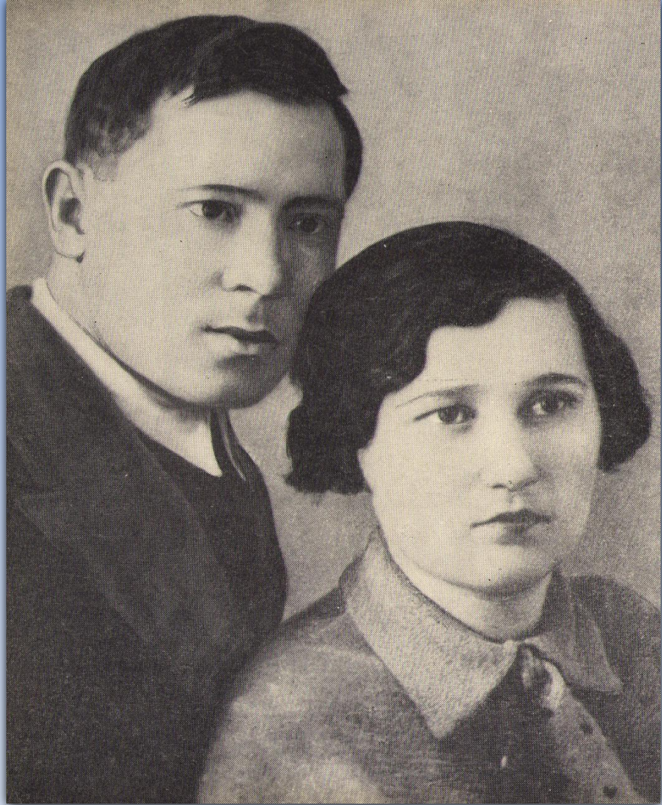
Муса Жәлил Әминә хатыны белән