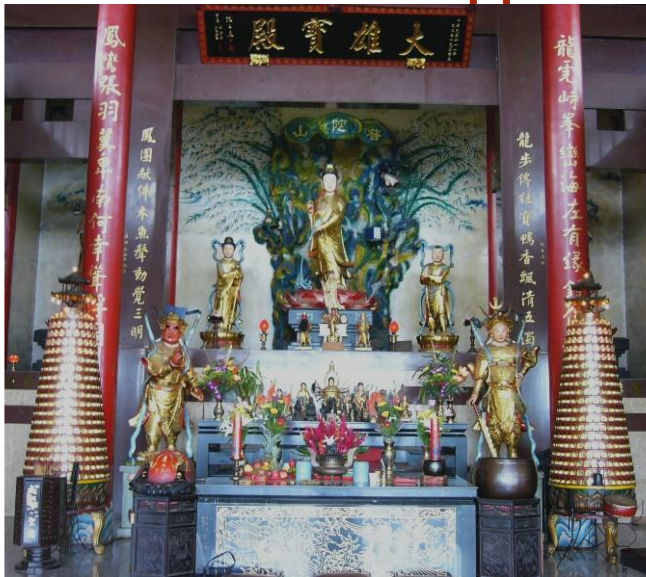
Даосский храм на острове Тайвань