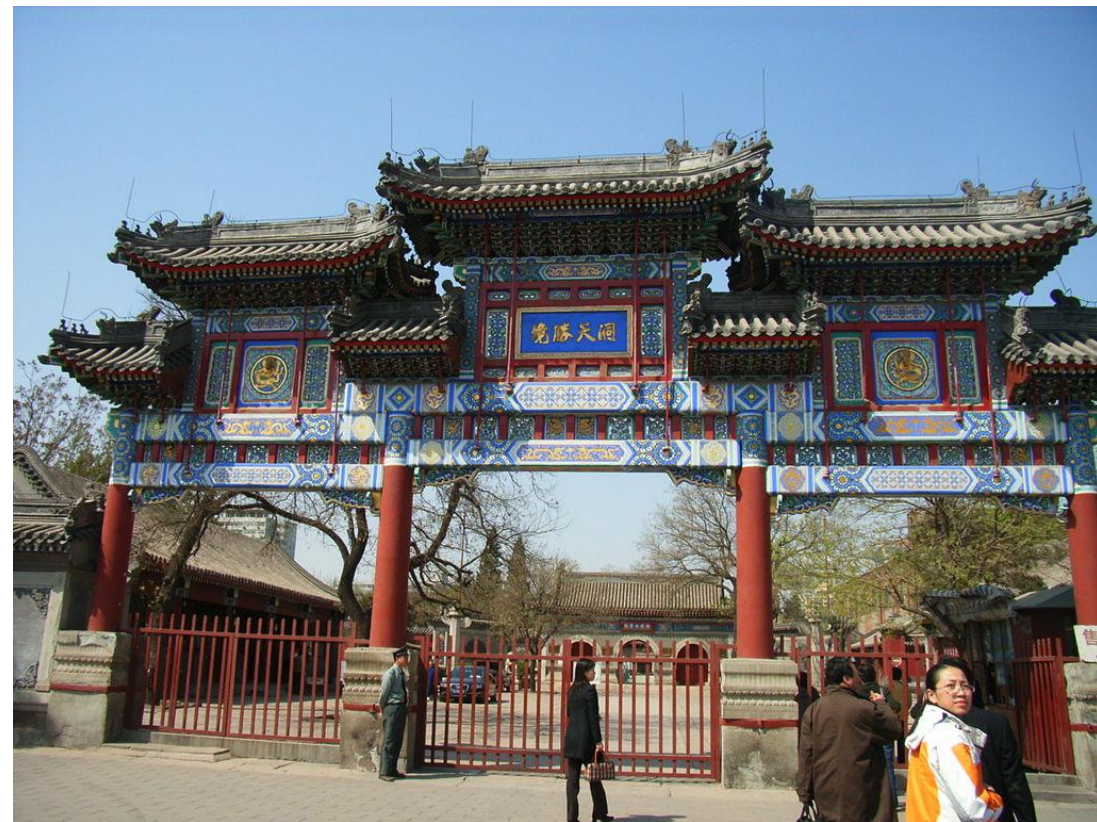
Ворота в даосский Храм Белых Облаков в Пекине (основан в 739 г.)