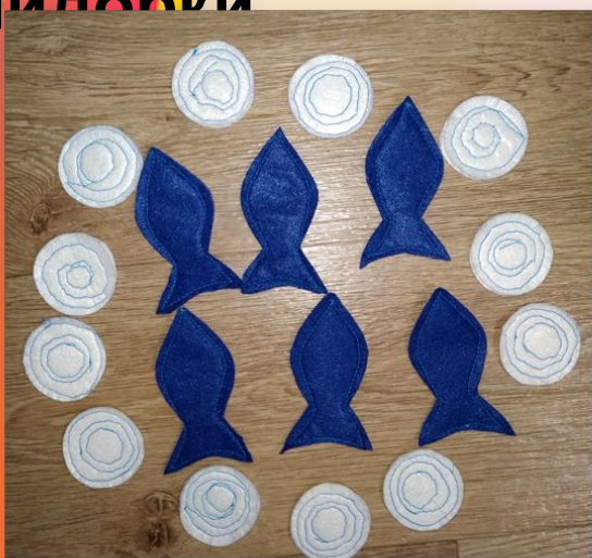
Рыбка и кружочки лука

Теперь приступаем к изготовлению ингредиентов для пиццы.