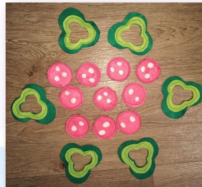
Колбаска и перчик