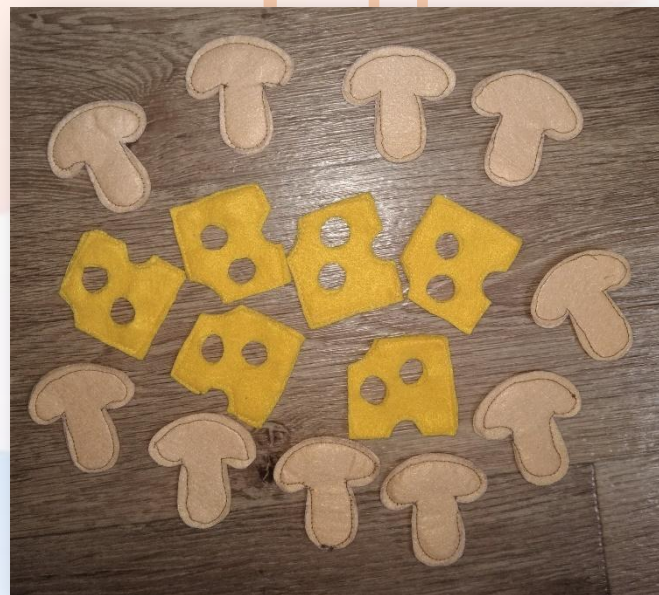
Шампиньоны и сыр

Теперь приступаем к изготовлению ингредиентов для пиццы.