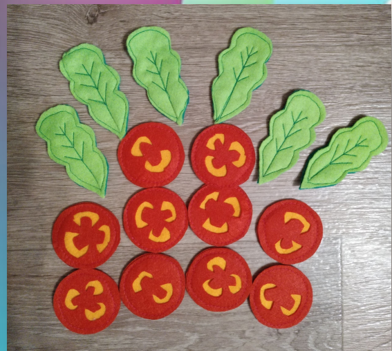
Листья салата и помидорки