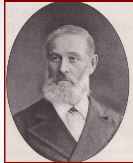
ПАВЕЛ ЕГОРОВИЧ ЧЕХОВ 1882 г.