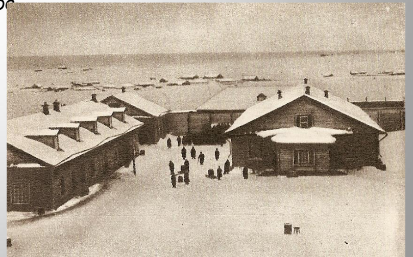
Сахалин. Воеводская тюрьма.