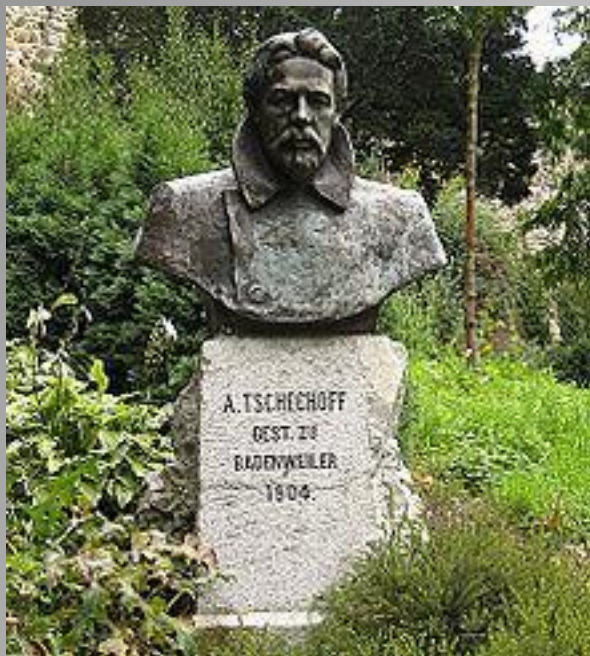
Памятник Чехову в Баденвайлере