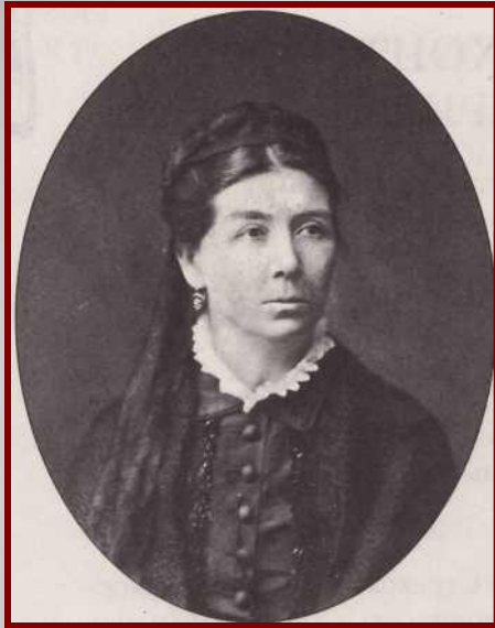
ЕВГЕНИЯ ЯКОВЛЕВНА ЧЕХОВА 1882