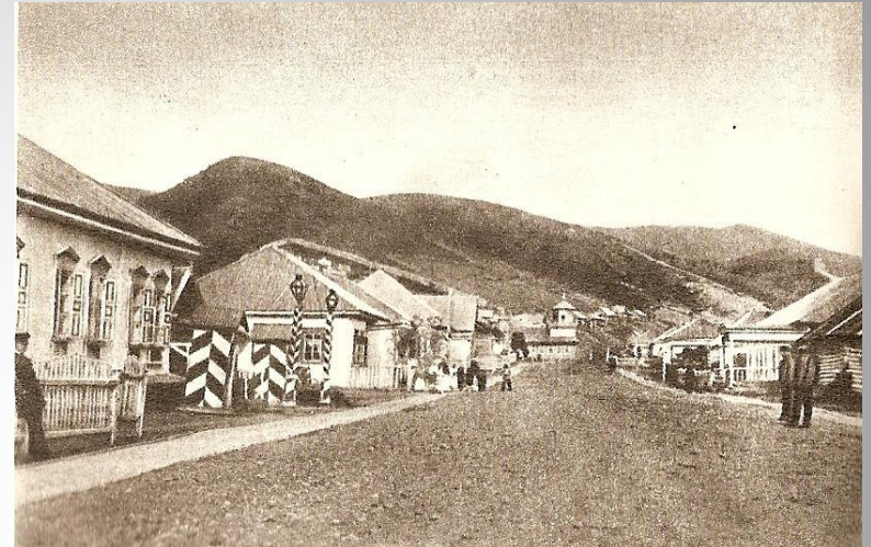
Пост Александровск на Сахалине, где жил А.П. Чехов

На Сахалин Чехов прибыл [23 июля|11(23) июля]. За несколько месяцев пребывания на нём Чехов общался с людьми, узнавал истории их жизни, причины ссылки и набирал богатый материал для своих заметок. Он провёл настоящую перепись населения Сахалина, собрав несколько тысяч карточек о жителях острова. Администрация острова строго запретила общаться с политическими