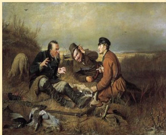
«Охотники на привале» Перов В. Г.