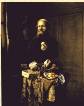
Якоби В.И. «Разносчик»,