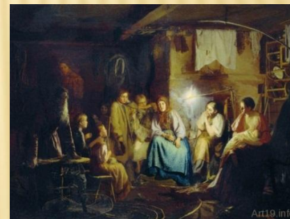
«Бабушкины сказки» Максимов В.М.