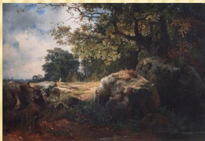
«Вид в окрестностях Ориенбаума» Саврасов А.К.