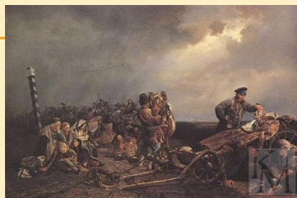
«Привал арестантов» Перов