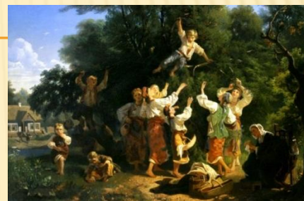
И.И. Соколов «Сбор вишен»