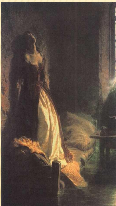
«Княжна Тараканова» Флавицкий К.Д.