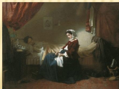
«Больной музыкант» Клодт М.П.