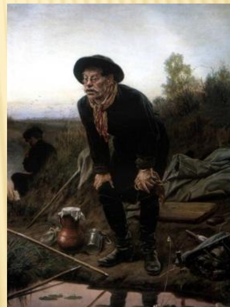
«Рыболов» Перов В. Г.