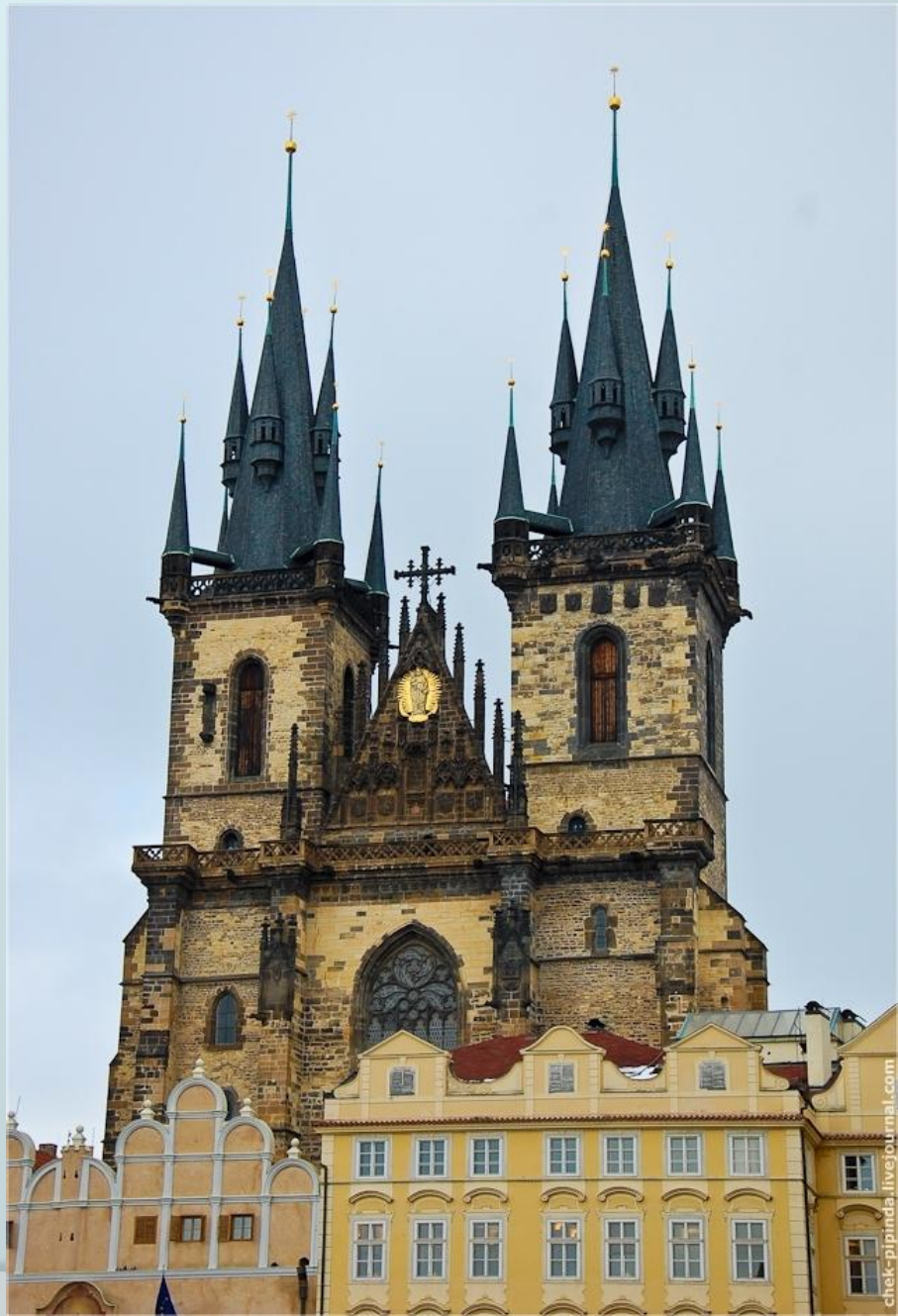
Храм Марии Тинской, Прага