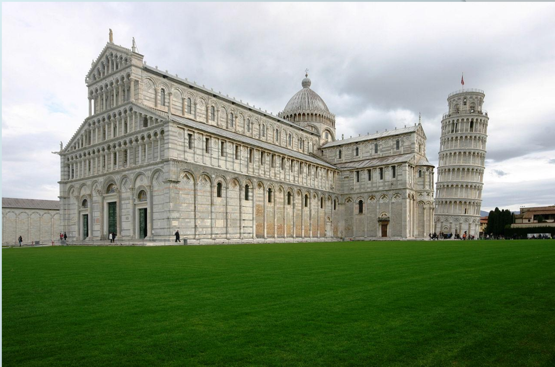
Пизанский собор, Италия