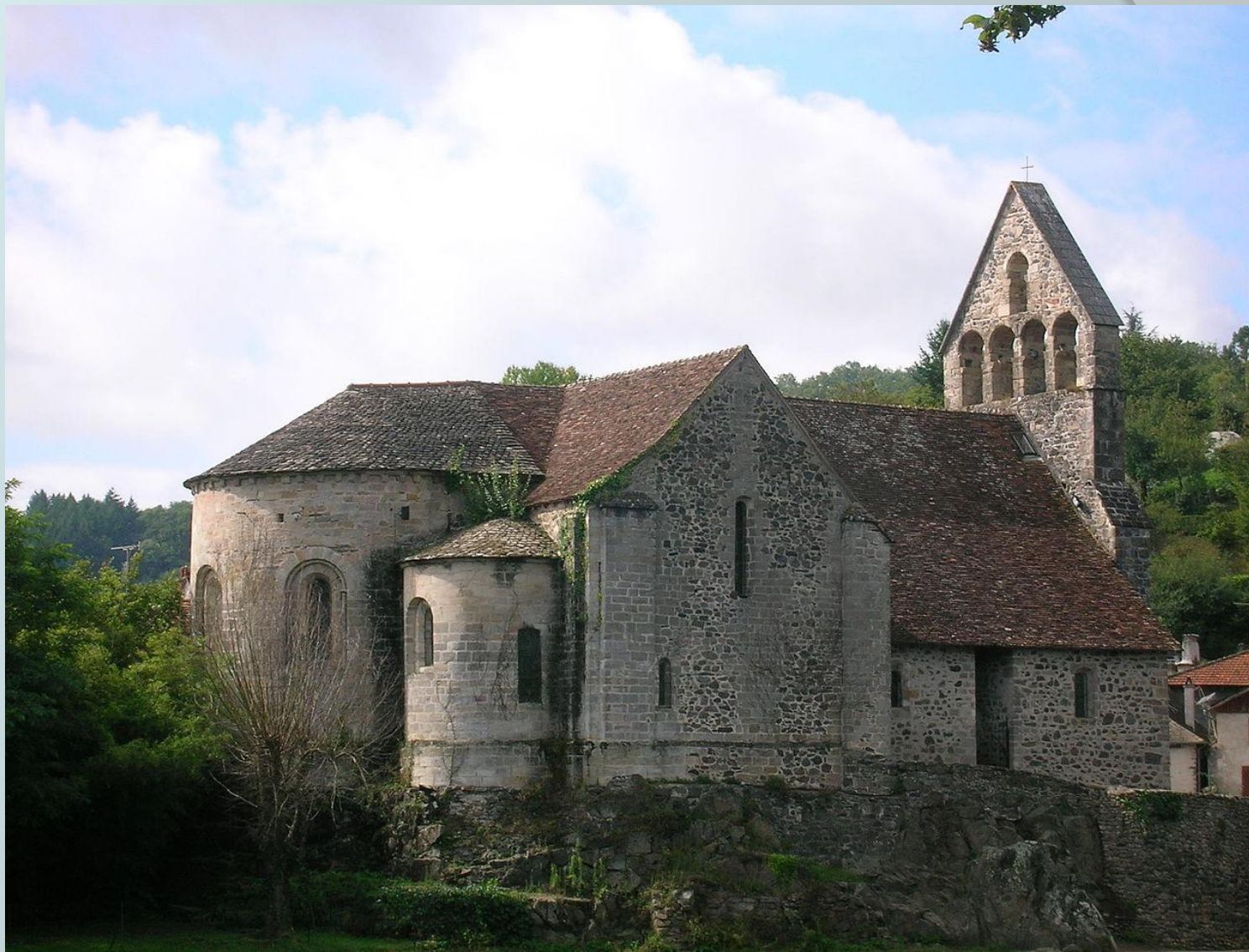
Капелла кающихся грешников, Больё-сюр-Дордонь.