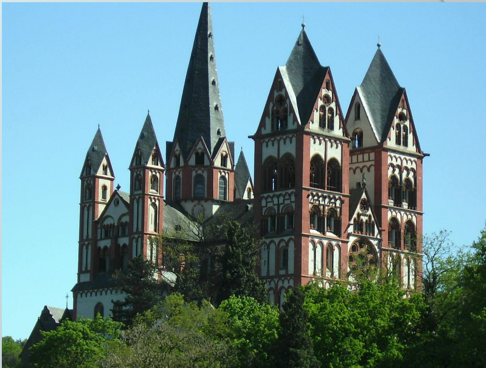
Либмургский собор, Германия