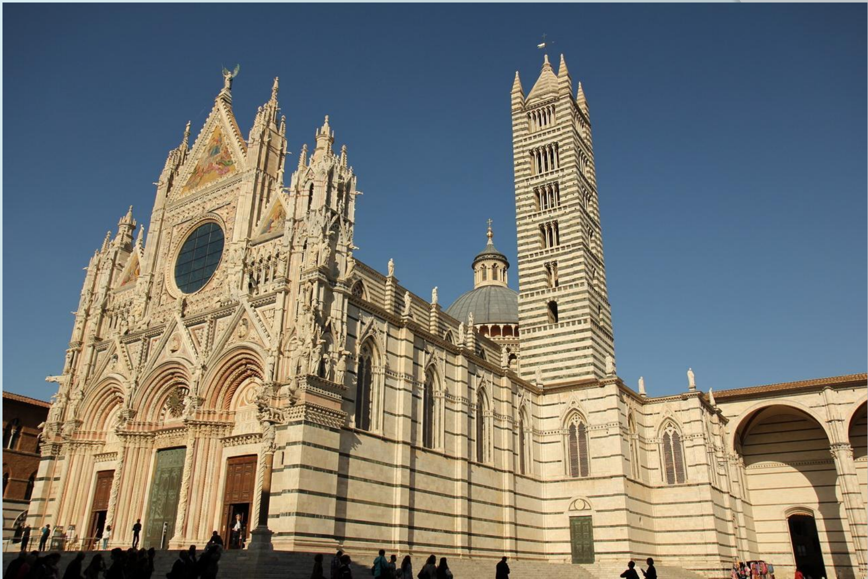
Сиенский собор, Италия