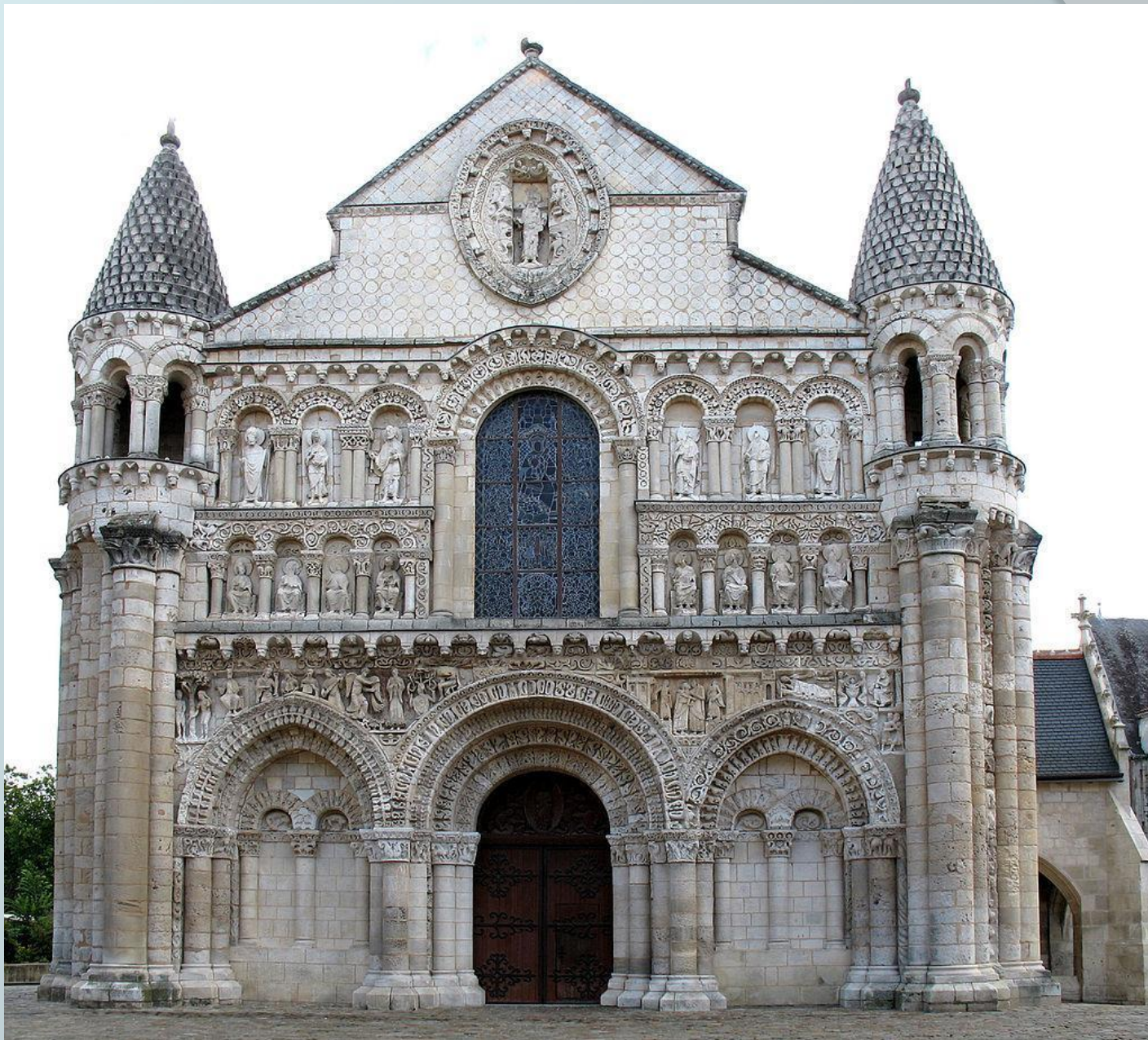
Церковь Нотр-Дам-ля-Гранд, Франция