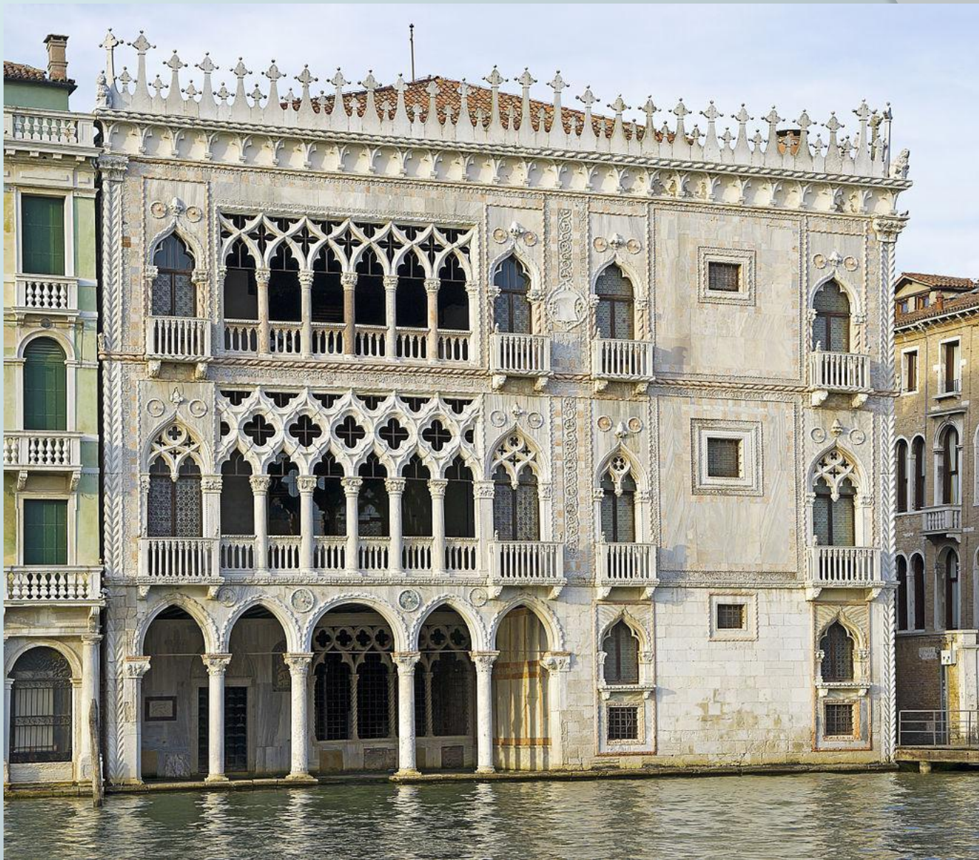
Ка' д'Оро, Венеция