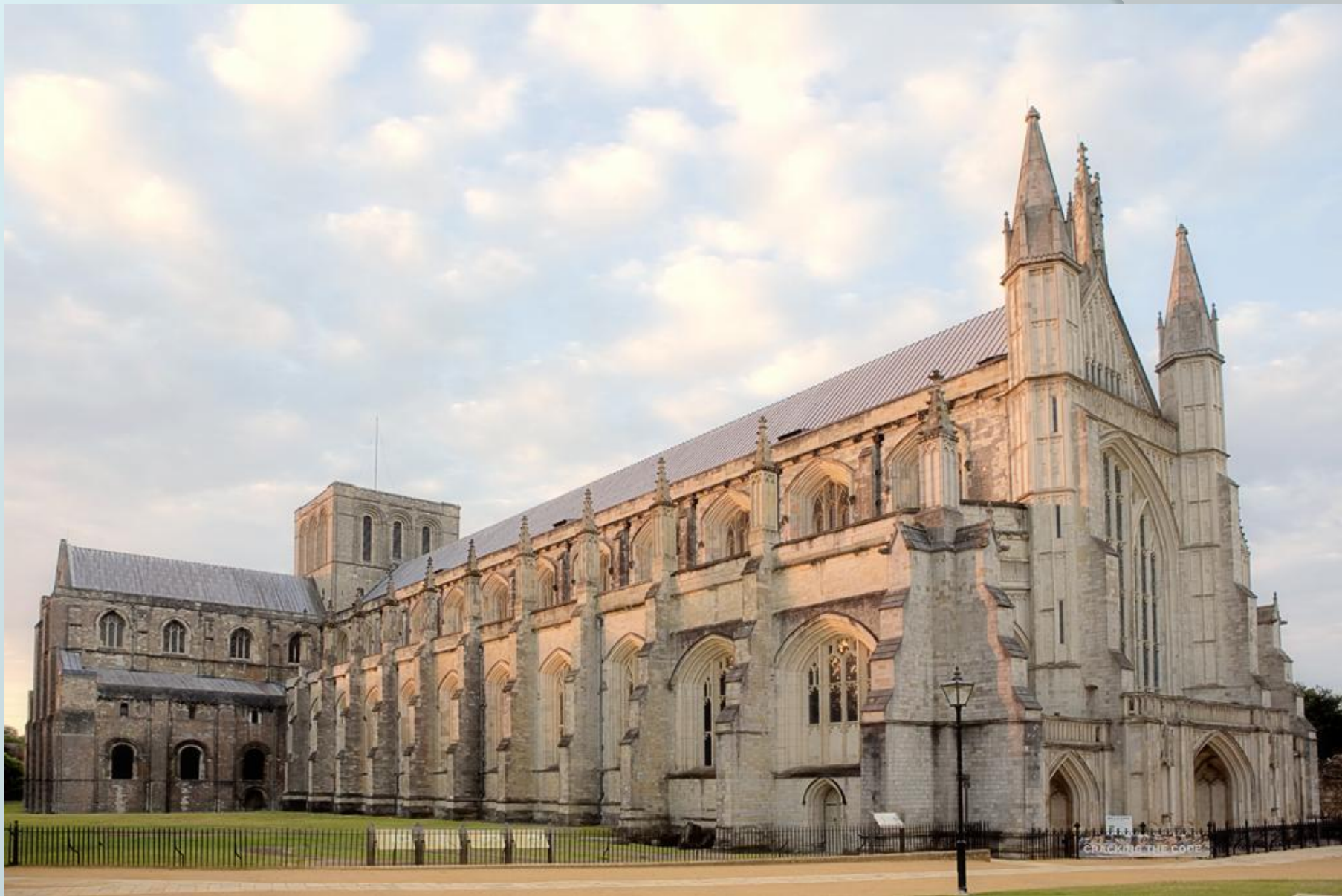
Уинчестерский собор, Англия