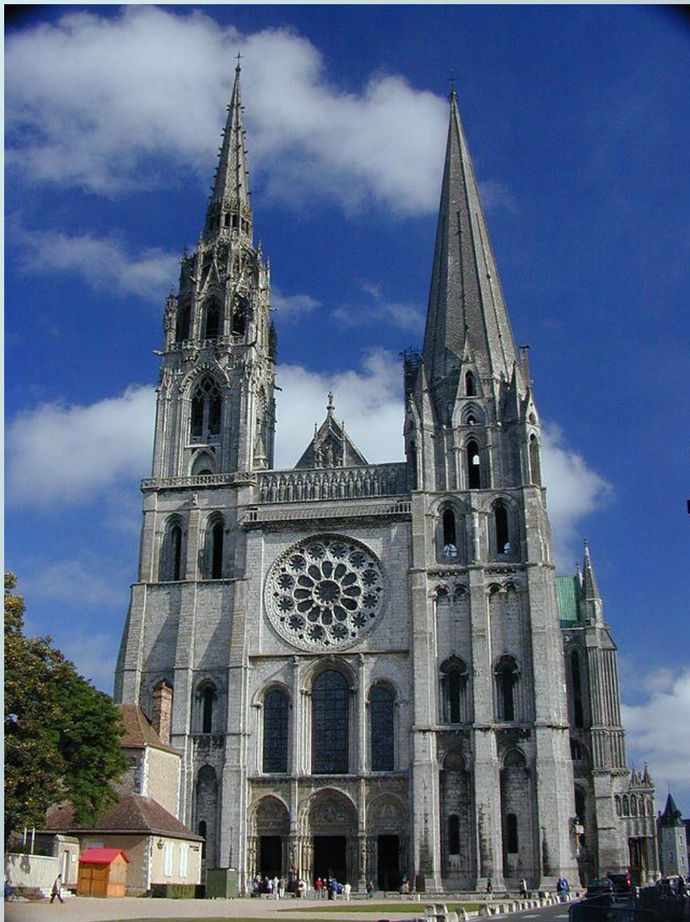
Шартрский собор, Франция