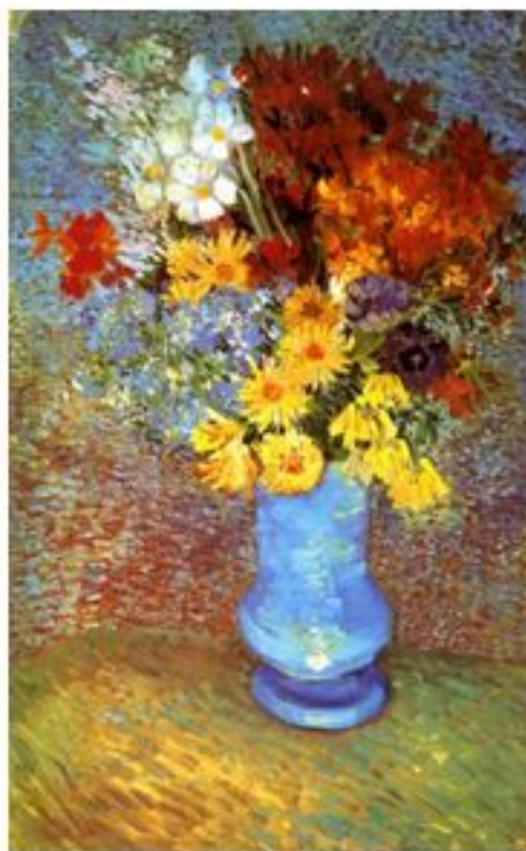
«Ваза с маргаритками и анемонами» Винсент Ван Гог

Маргаритка – символ цветка любви и «предсказателя» в сердечных делах. У многих западноевропейских народов барышни гадали на маргаритке. Средневековый рыцарь, получивший согласие своей дамы, изображал на щите маргаритку. Если избранница не была готова ответить на его любовь, она дарила ему венок из маргариток, что значило «еще подумаю». «Готовь, земля, цветам из рос напиток,/ Дай сок стеблю.../ О девушки! О, звезды маргариток! / Я вас люблю...» (И. Северянин. Маргаритки)