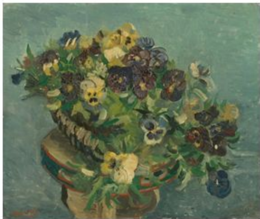
«Корзина фиалок» Винсент Ван Гог

Фиалка – в Древней Греции фиалка считалась символом печали и смерти – ею покрывали смертное ложе и могилы безвременно погибших девушек. Однако, более известна фиалка как символ скромности, верности и любви. «...Печально небо иль ликует, / Зефир ли дует иль Борей, / Смеется, пахнет и чарует / Фиалка в комнате моей.» (Т. Готье. Цветок, что делает весну)