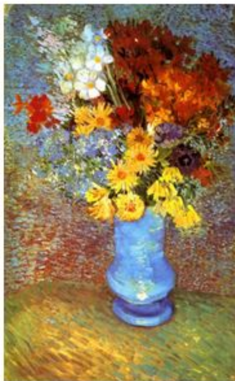
«Ваза с маргаритками и анемонами» Винсент Ван Гог

Маргаритка – символ цветка любви и «предсказателя» в сердечных делах. У многих западноевропейских народов барышни гадали на маргаритке. Средневековый рыцарь, получивший согласие своей дамы, изображал на щите маргаритку. Если избранница не была готова ответить на его любовь, она дарила ему венок из маргариток, что значило «еще подумаю». «Готовь, земля, цветам из рос напиток,/ Дай сок стеблю.../ О девушки! О, звезды маргариток! / Я вас люблю...» (И. Северянин. Маргаритки)