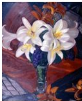
«Лилии» Николай Константинович Рерих

Красная лилия, согласно преданию, появилась в Гефсиманском саду в ночь перед распятием Христа: это белая лилия покраснела от стыда за свое тщеславное желание покрасоваться. Слово в знак сострадания крестным мукам Спасителя, красная лилия, в отличие от белой, всегда держит головку склоненной вниз.