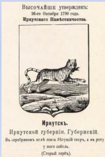
Один из первых гербов Иркутска