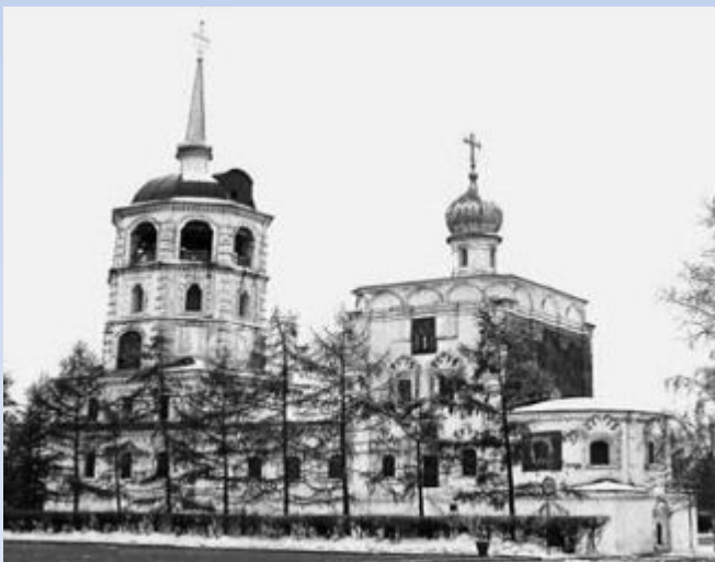
Первая каменная церковь