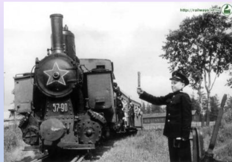
Танк-паровоз 57-90 1951 год.