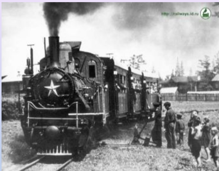
1839 год прошел первый поезд по детской дороге