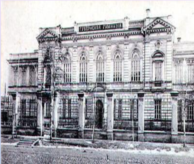
В 1805 году открывается Иркутская губернская гимназия