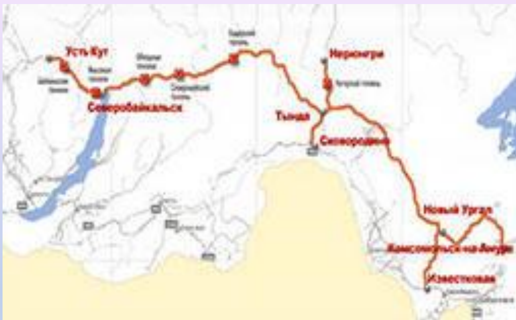
Карта Байкала – Амурской магистрали