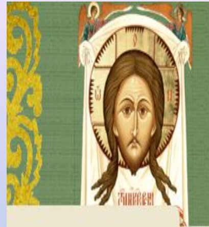
Икона Спаса Нерукотворного