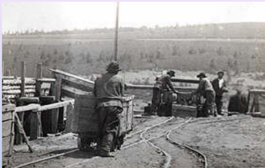
1747 год развиваются мануфактуры