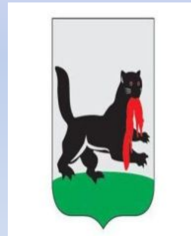
Современный герб города