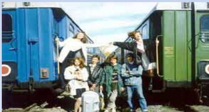
Сейчас на дороге одновременно курсирует два состава – «Сибирячок» и «Малый Байкал» из семи вагонов каждый.