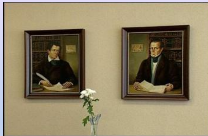
ГУМАНИТАРНЫЙ ЦЕНТР СЕМЬИ ПОЛЕВЫХ