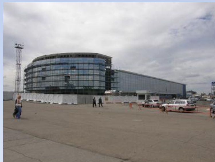
Современный аэропорт Иркутска