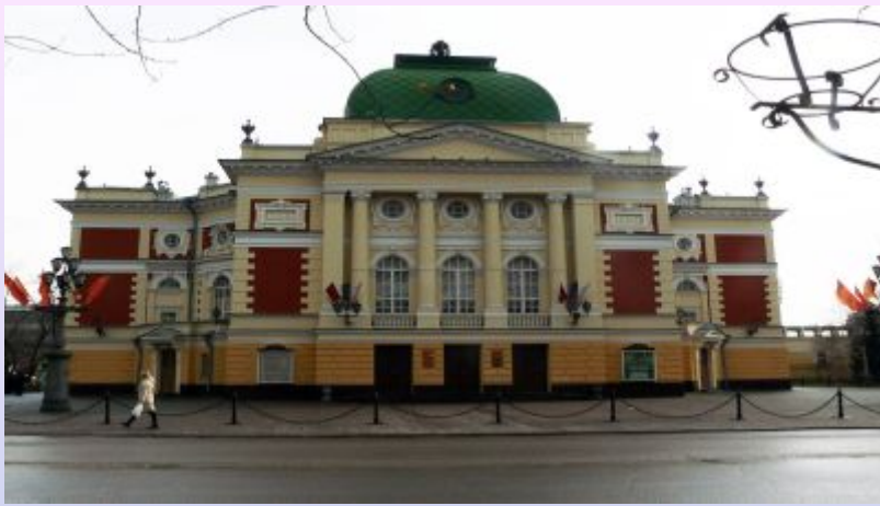
Академический драматический театр им. Н.П.Охлопкова 1897 г.