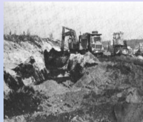
Начало строительства БАМа 1974 года