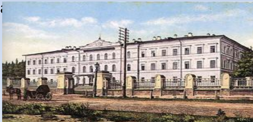
Сиропитательный дом 1837 г.