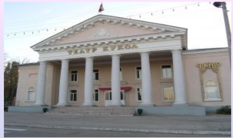
Иркутский областной театр кукол "Аистенок" был открыт в 1935 году