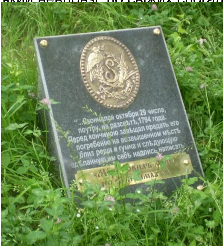
Меморіальна плита на місці першого поховання

Помер Григорій Сковорода 29 жовтня 1794 р. в селі Пан-Іванівка (нині Сковородинівка) на Харківщині, в маєтку М. Ковалинського, який невдовзі по свіжих спогадах, склав його першу біографію.