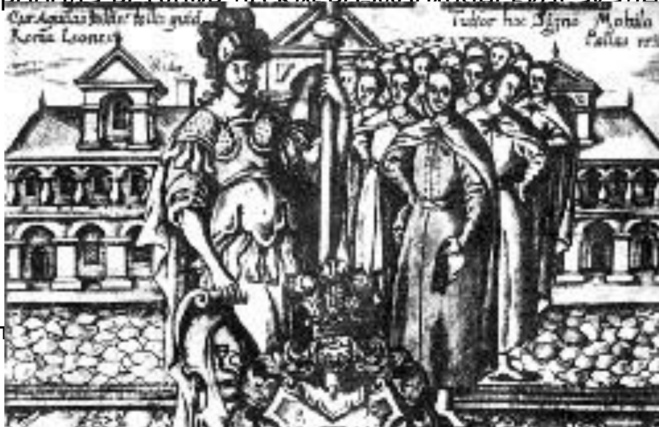
ЛІТОГРАФІЯ. СТУДЕНТИ КИЄВО-МОГИЛЯНСЬКОЇ АКАДЕМІЇ. КІНЕЦЬ XVII СТ.

Імовірно, в 1734 р. (називаються й інші дати) Г. Сковорода вступив до Києво-Могилянської академії.