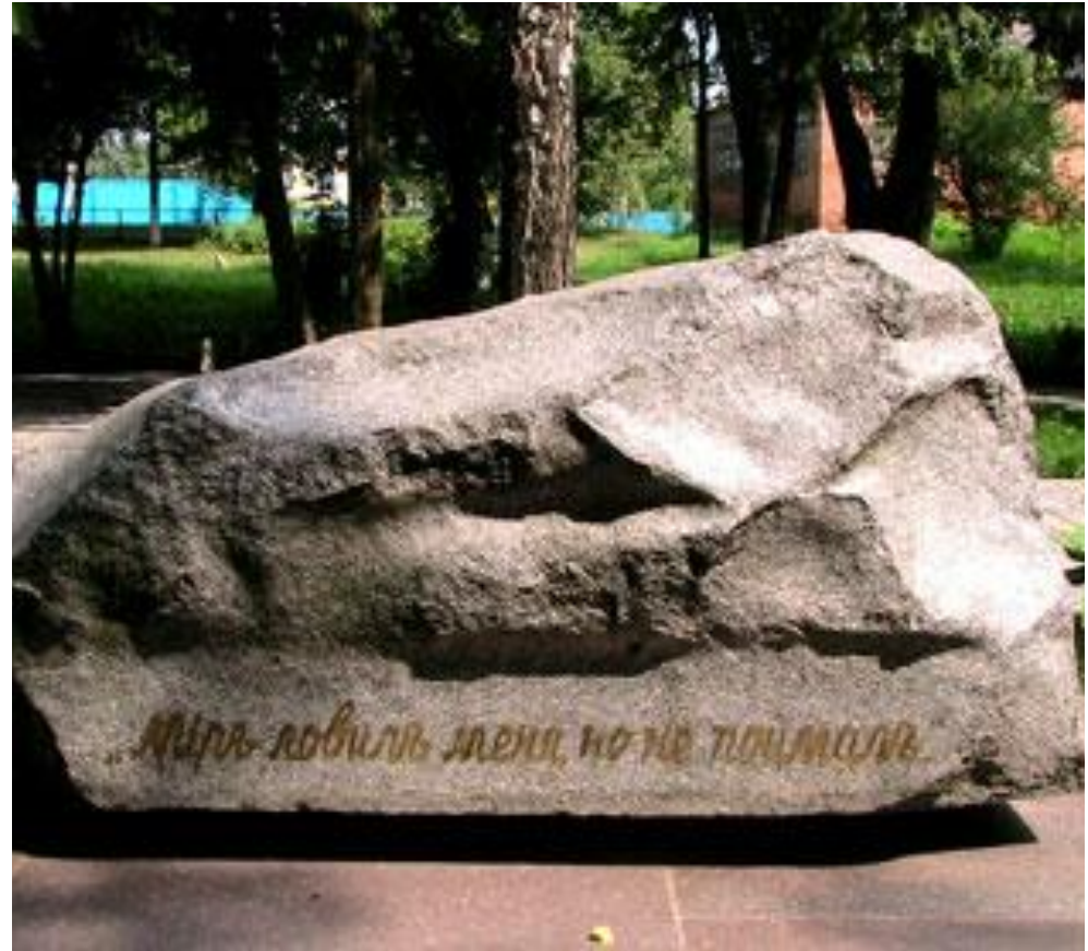
Місце поховання, с.Сковородинівка