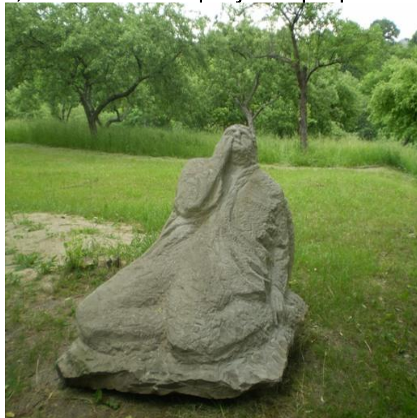
Скульптура “Блудний син”