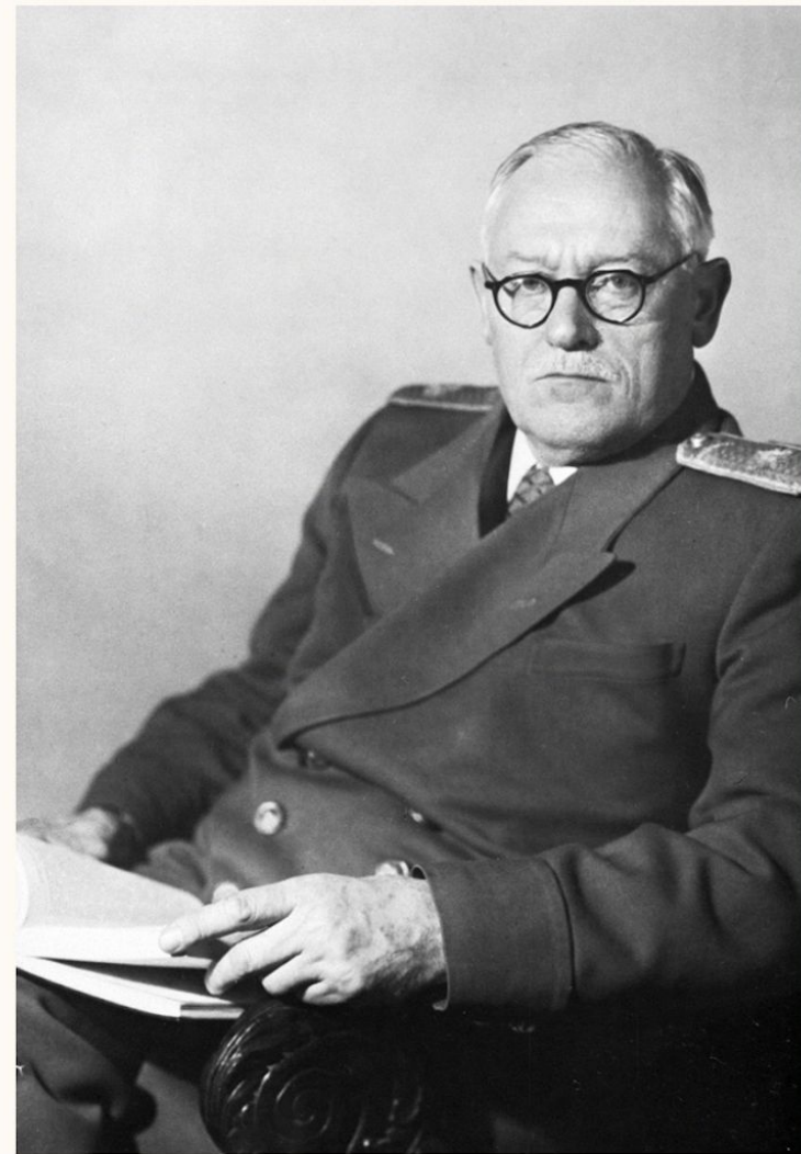
Вышинский А. Я.

По его словами эти отрасли составляли "альфу и омегу" системы социалистического права.