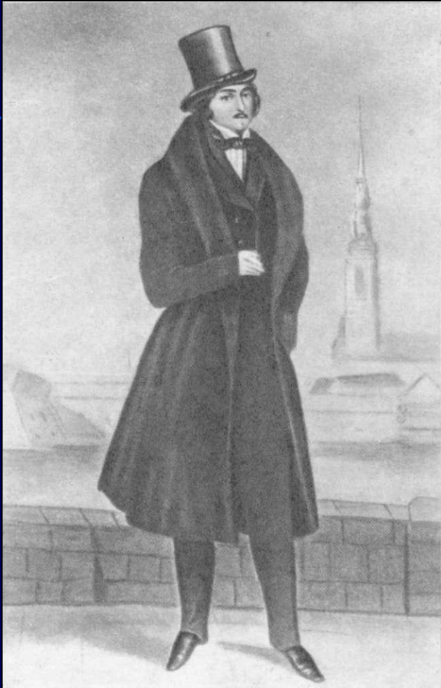
Гоголь Николай Васильевич (1809-1854)