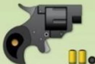
пистолеты с резиновыми пулями или маленькими шарикам