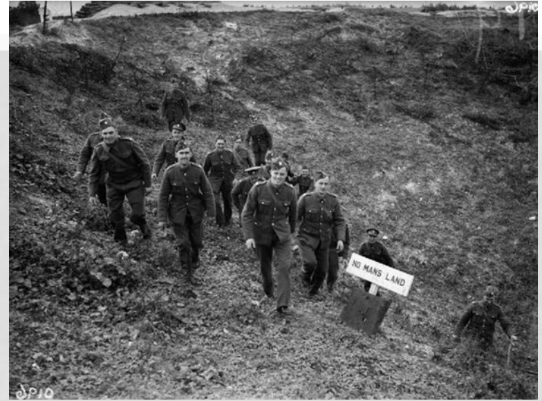
Нейтральная территория, период «странной войны» 1939-1940гг

Слух-желание осуществляет двоякую функцию. С одной стороны, он соответствует пожеланиям людей препятствует развитию негативных эмоций. С другой стороны, такие слухи деморализуют население, создавая завышенные ожидания.