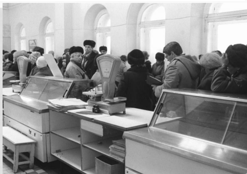
Пустые прилавки магазина, СССР, 1990г

Слух-пугало - слух, несущий и вызывающий выраженные негативные, пугающие настроения, отражающие некоторые актуальные, но нежелательные ожидания аудитории, в которой они возникают и распространяются.