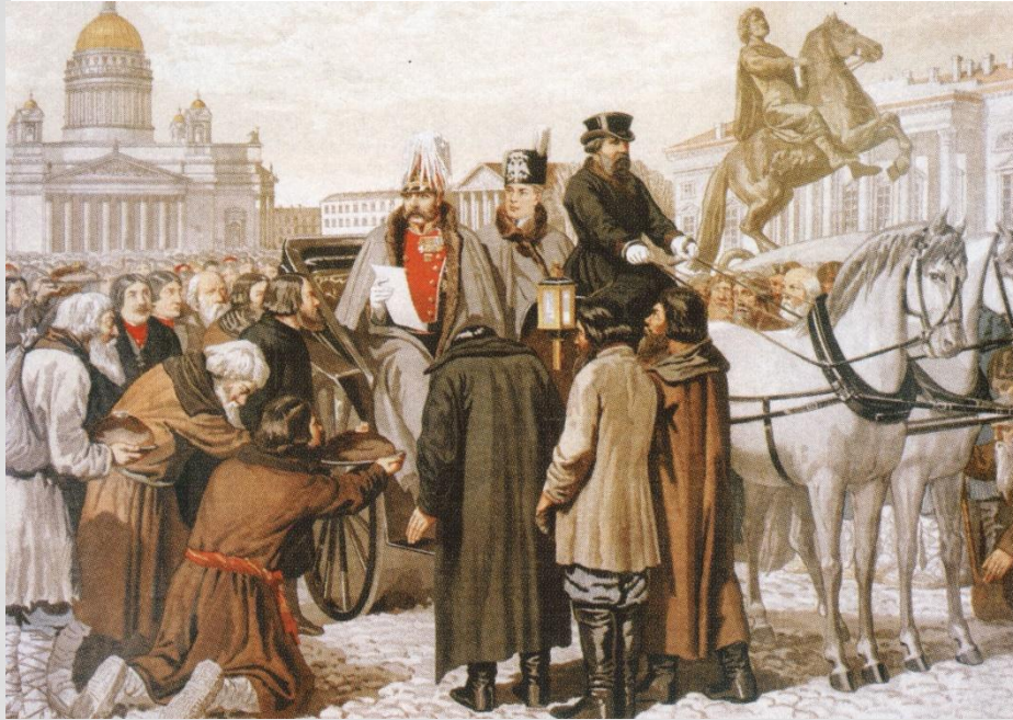
Александр II читает манифест о даровании свобод крепостным