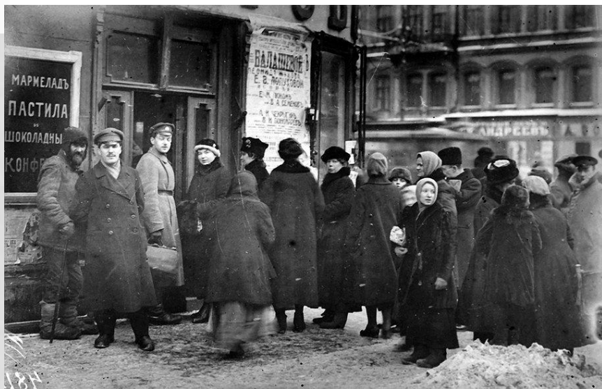
Очередь за хлебом, Петроград, 1917