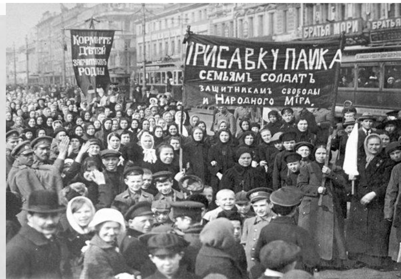
Демонстрация в Петрограде, 1917г

Основная функция агрессивных слухов — не просто запугивание, а провокация агрессивных действий.