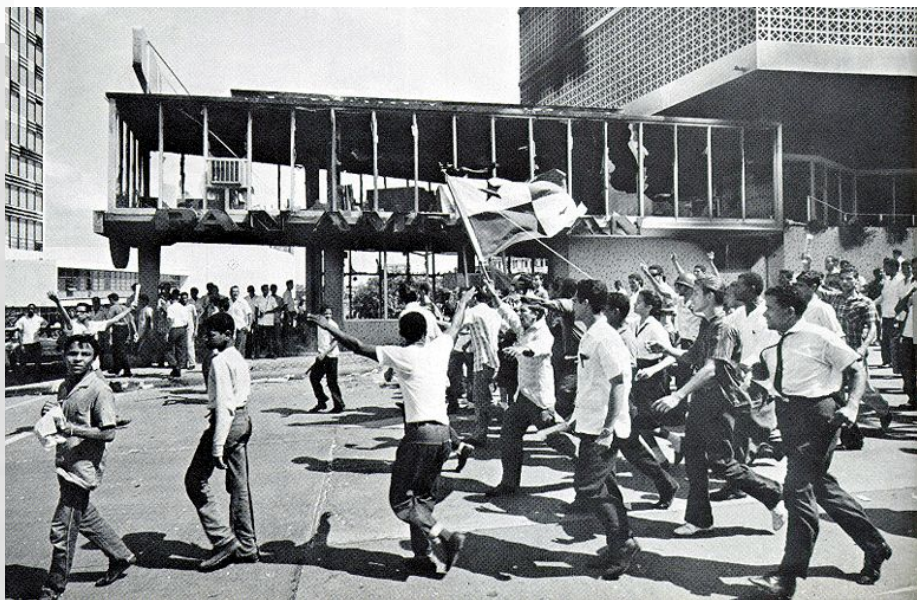
Антиамериканские выступления в Панаме, 1964г