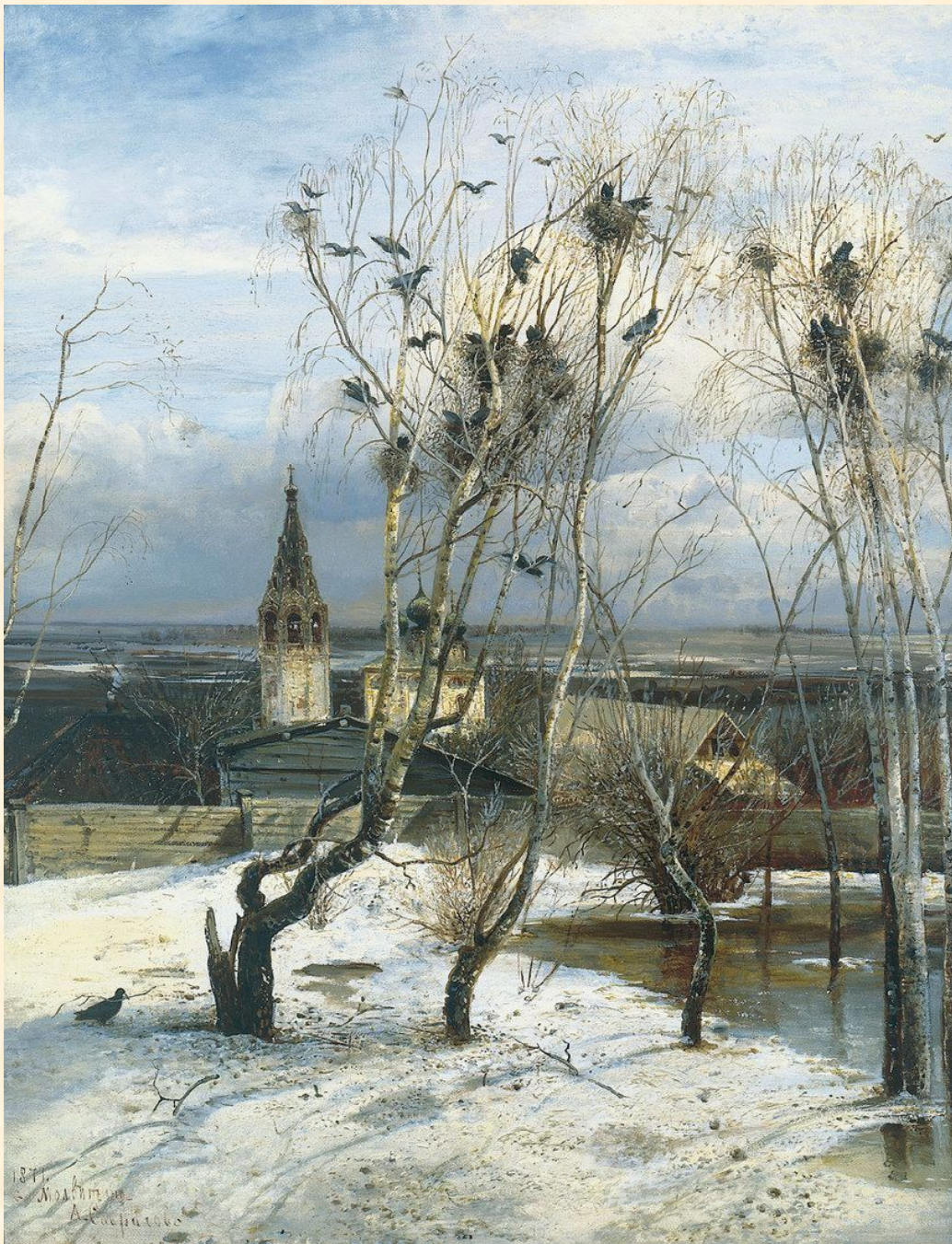
САВРАСОВ А. К. ГРАЧИ ПРИЛЕТЕЛИ. 1871