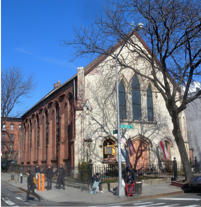
Собор Святого Кирилла Туровского (Нью-Йорк)