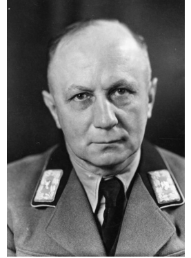
Вильгельм Кубе, Ген. комиссар Ген. округа Белоруссия

Новгородские и Смоленские земли вошли в состав "второго призыва"