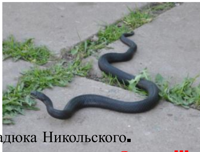
2 гадюка Никольского.