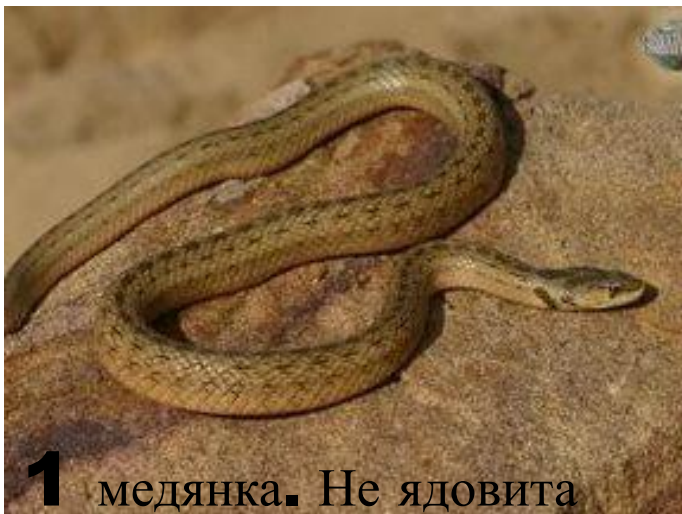
1 медянка. Не ядовита

Встречаются ли в нашей местности ядовитые змеи? Если «да», то назови номер.