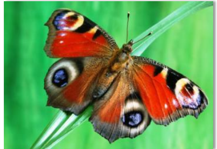
2 павлиний глаз