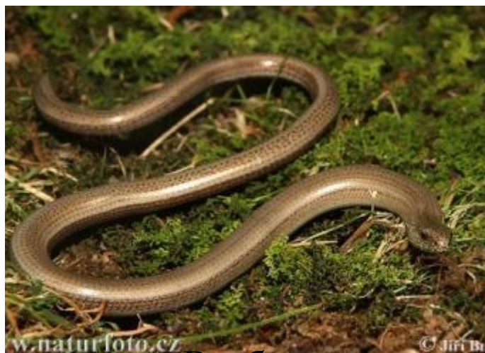
3 веретеница. Вообще не змея, а безногая ящерица