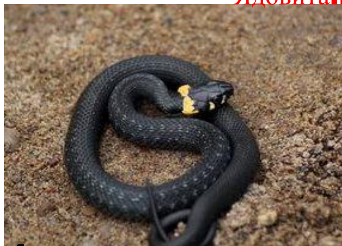
4 уж. Не ядовит