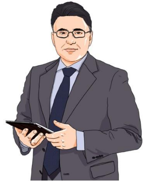
Александр Жаров руководитель Роскомнадзора

Мы хотим помочь нашим детям понимать последствия, которые информационные технологии могут оказать на личную жизнь, и предоставить вам инструменты и информацию, необходимые для принятия решений в вопросах виртуальной жизни.