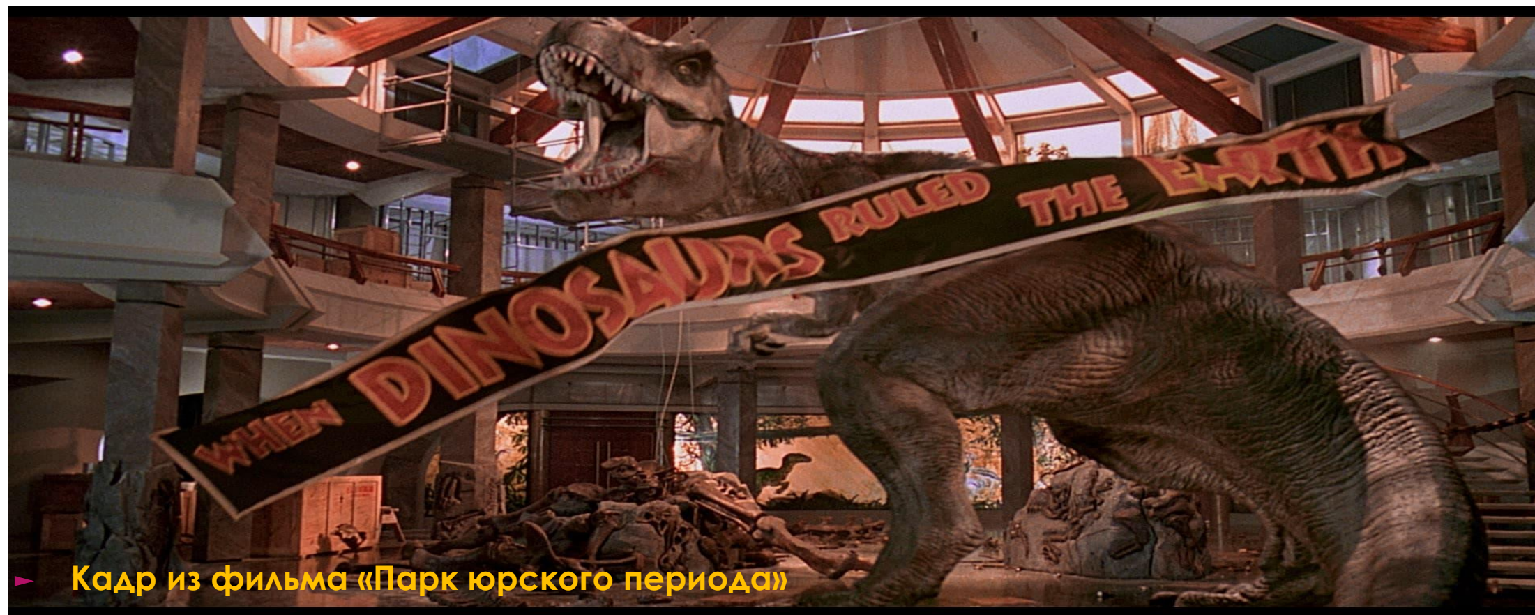
▶ Кадр из фильма «Парк юрского периода»

Динозавры очень популярны про них снимают фильмы и мультфильмы.