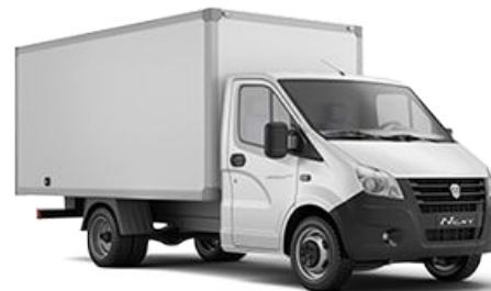
Легкий коммерческий транспорт