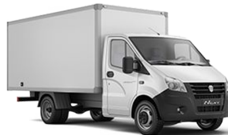
Легкий коммерческий транспорт