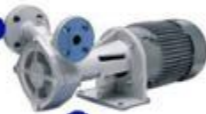
Насос выдачи СУГ