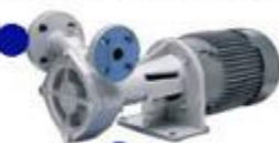
Насос выдачи СУГ