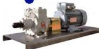
Насос слива СУГ