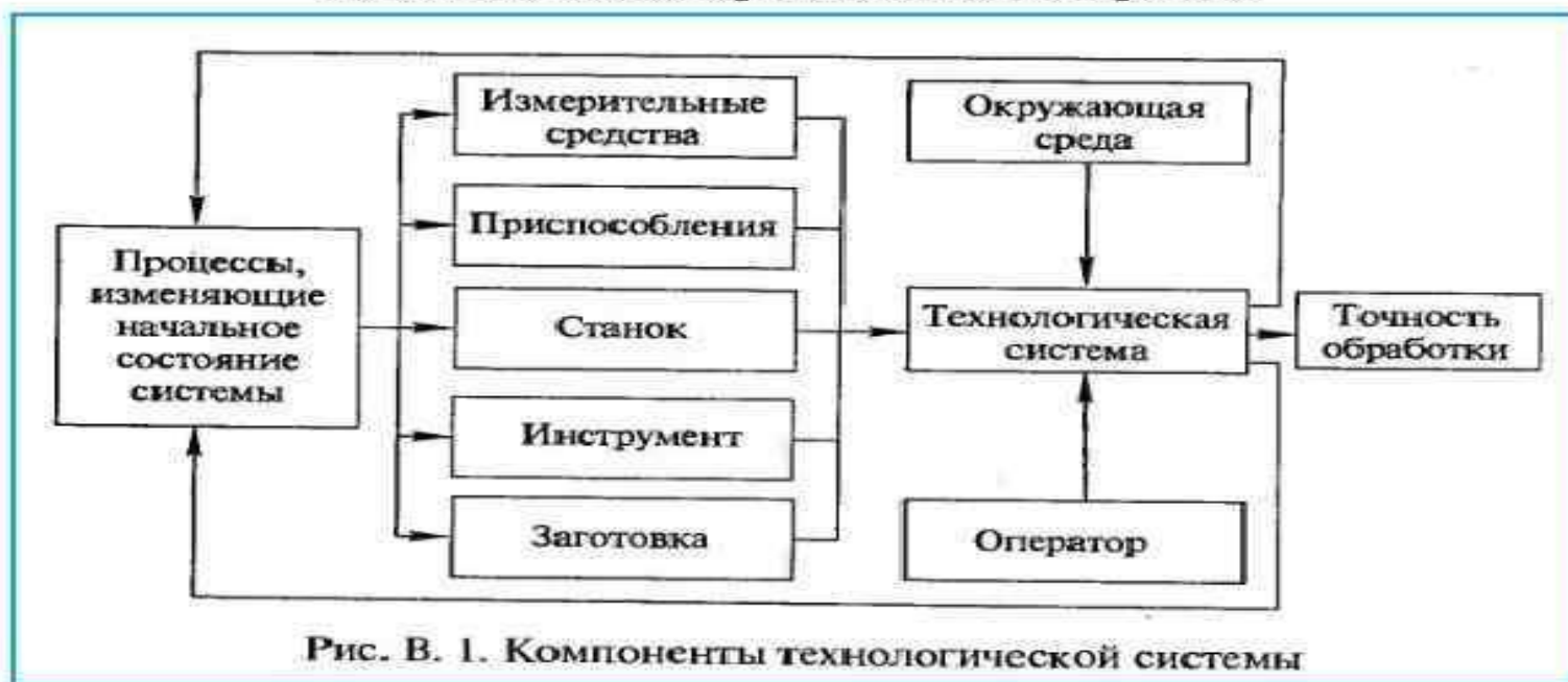
Рис. В. 1. Компоненты технологической системы

Технологическая система - совокупность функционально взаимосвязанных средств технологического оснащения, предметов производства и исполнителей для выполнения в регламентированных условиях производства заданных технологических процессов или операций.