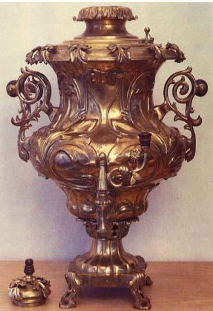
Самовар – ваза «Флорентийская ваза»