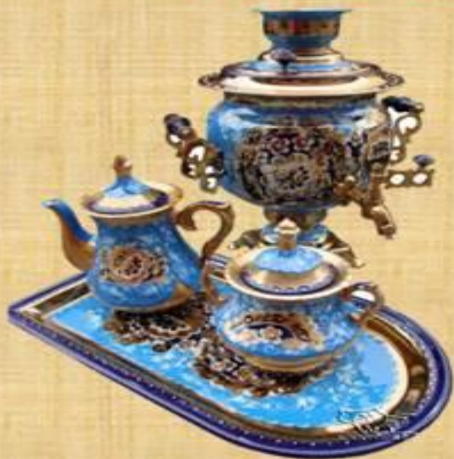
« Золотая Гжель »