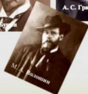
М. А. Волошин