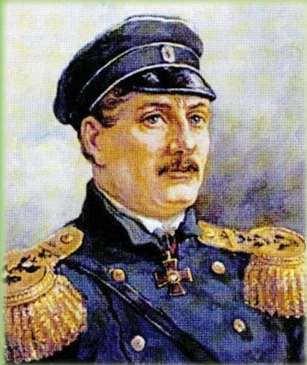
Павел Степанович Нахимов- русский флотоводец, адмирал , герой Крымской войны 1853-1856 года.