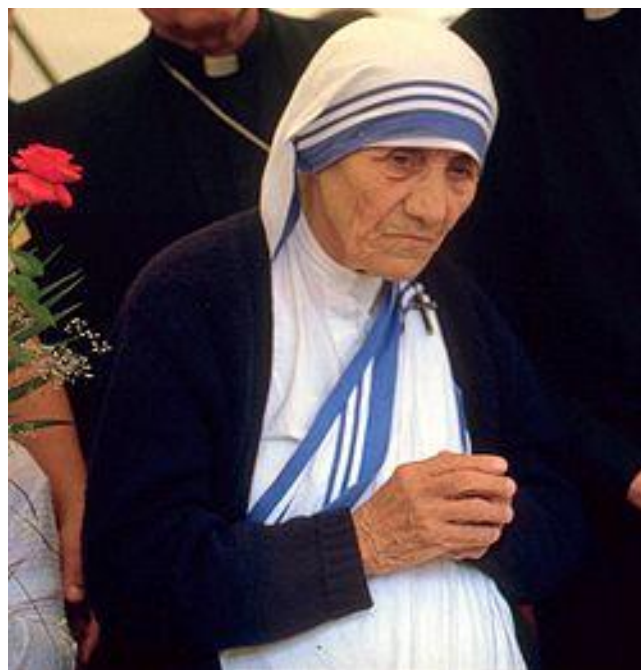
Мать Тереза Калькуттская (настоящее имя Агнес Гонджа Бояджиу)