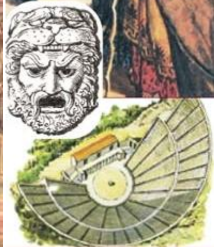
Театр Диониса в Афинах. Маски