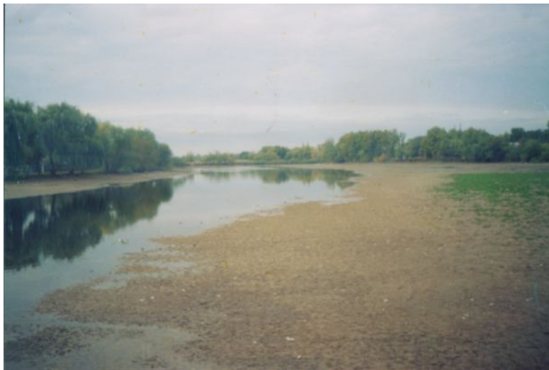
Река Челбас 1998 год

Свалки мусора в водоохранной зоне реки Челбас