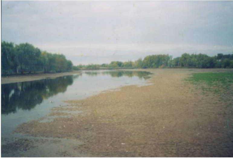
Река Челбас 1998 год

Свалки мусора в водоохранной зоне реки Челбас