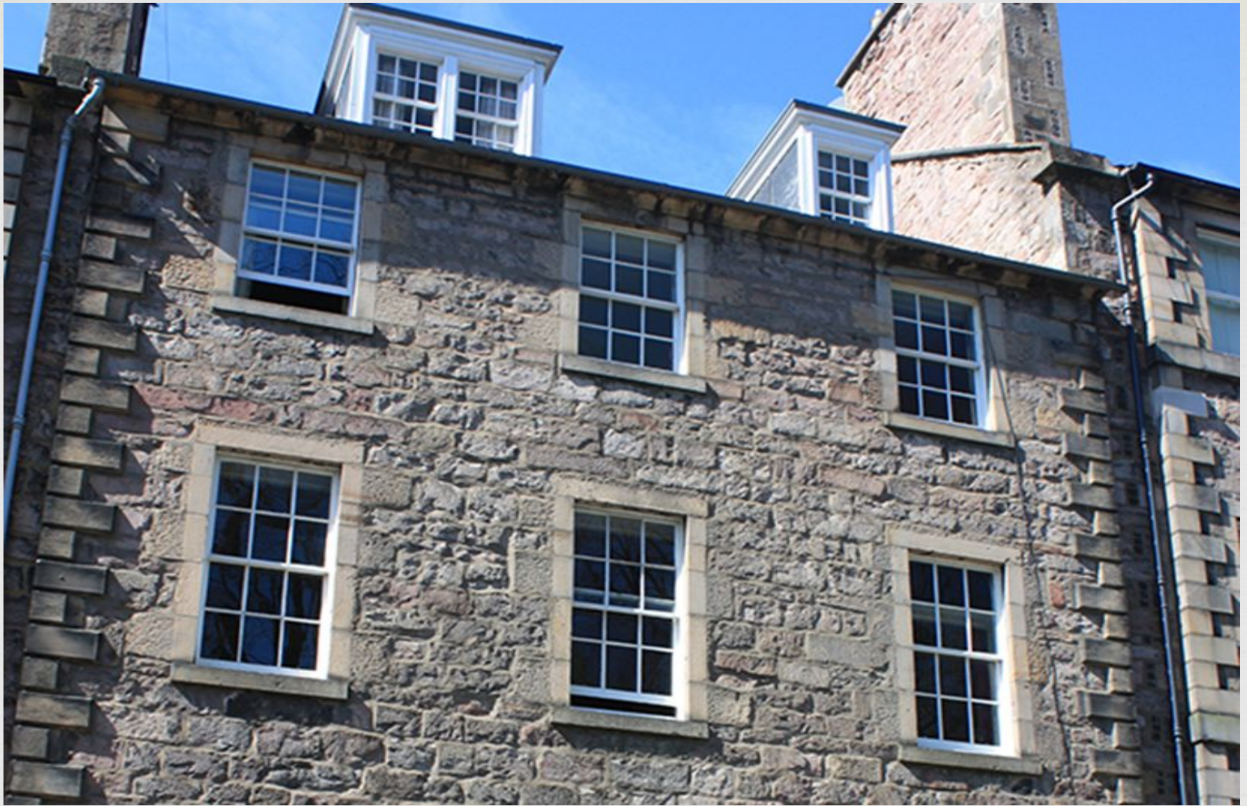
Дом, в котором Вальтер Скотт жил в детстве.