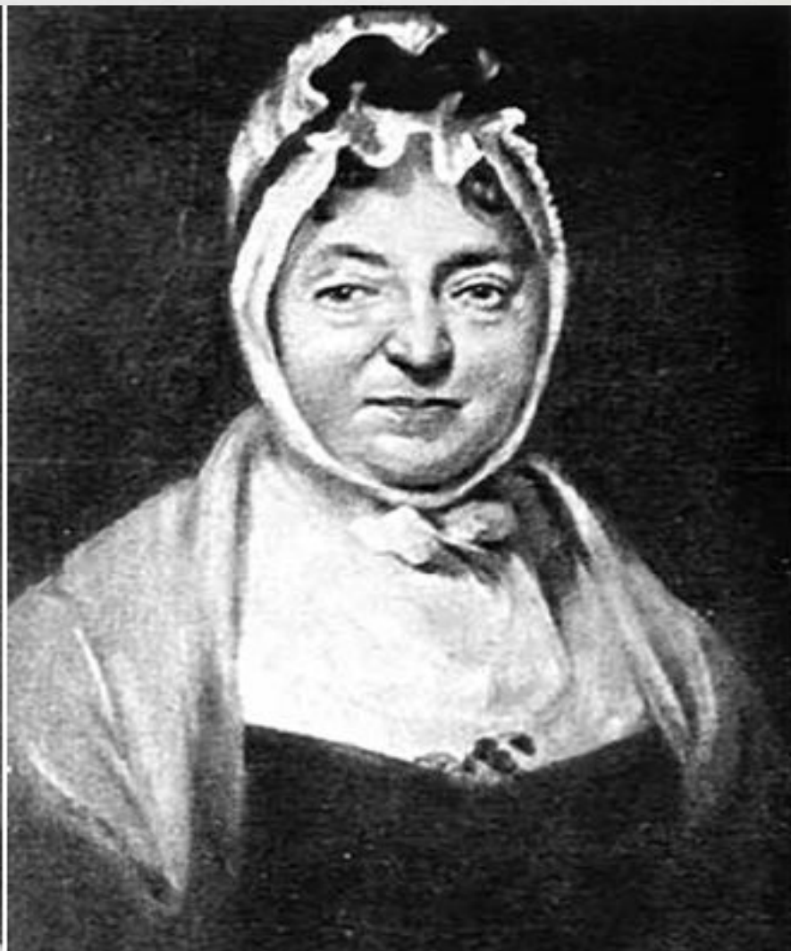
Родители Вальтера Скотта