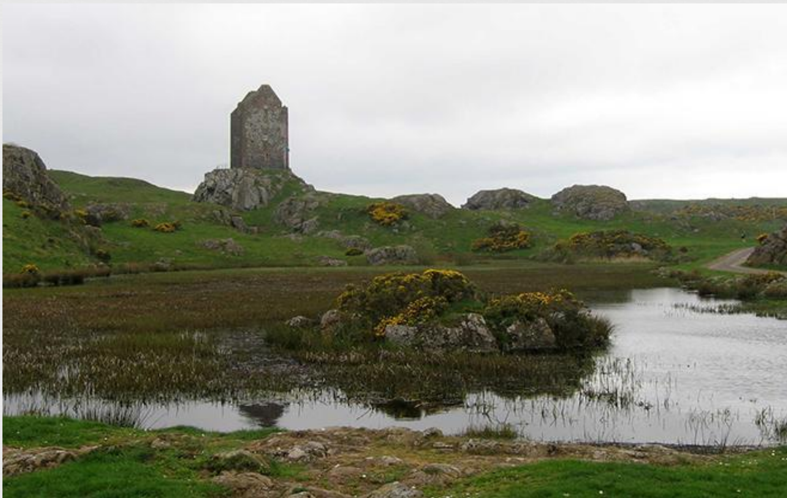
Башня Смайлхолъм, где проводил свой досуг юный Вальтер Скотт.