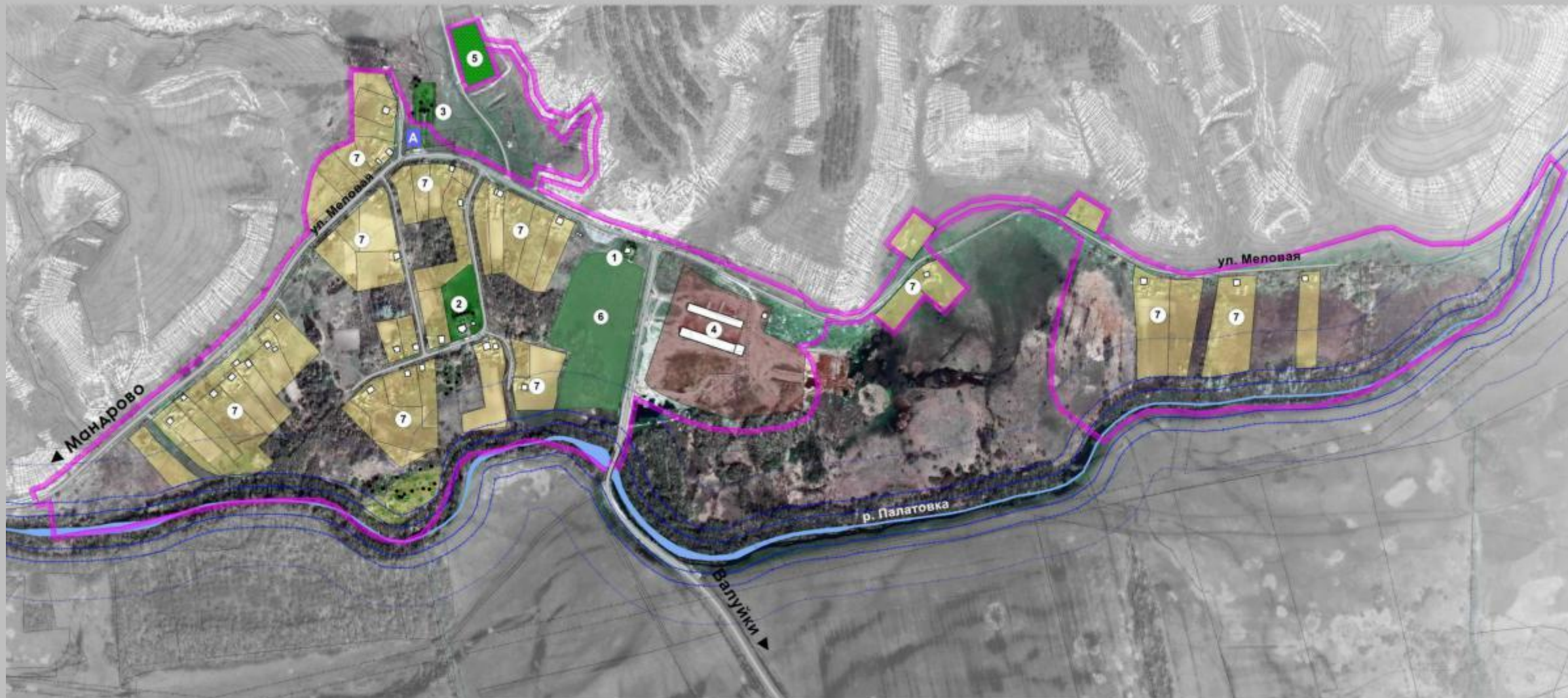
СХЕМА ФАКТИЧЕСКОГО СОСТОЯНИЯ С. ВАТУТИНО