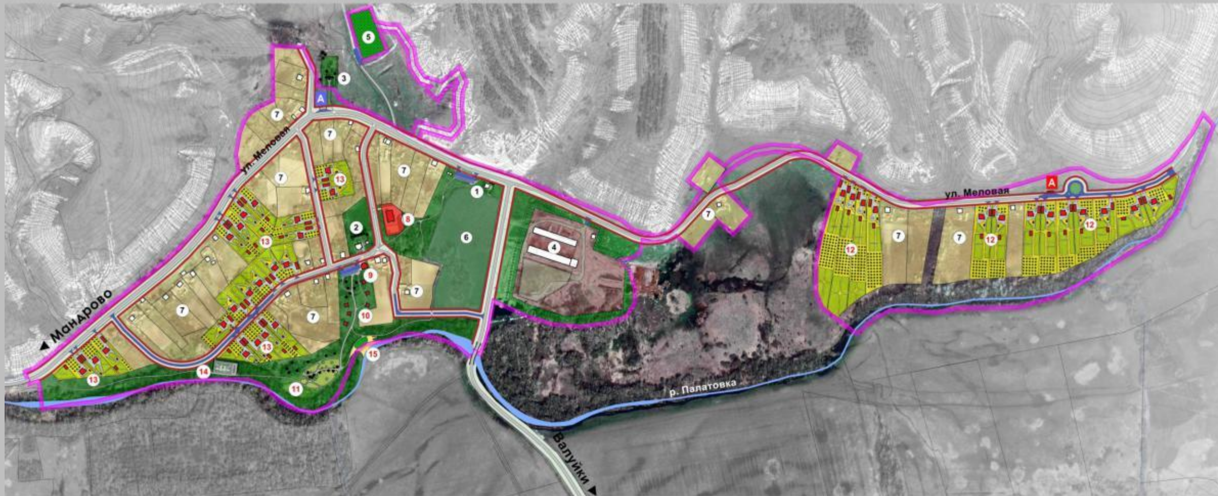
СХЕМА ПРЕДЛОЖЕНИЙ ПО РАЗВИТИЮ С. ВАТУТИНО