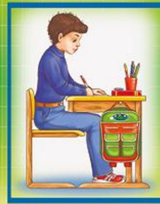
Посадка при письме