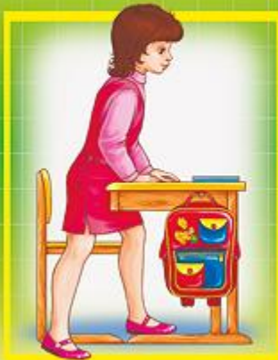
Посадка за парту