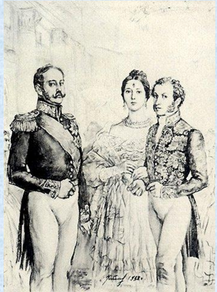
Николай I был личным цензором А. С. Пушкина