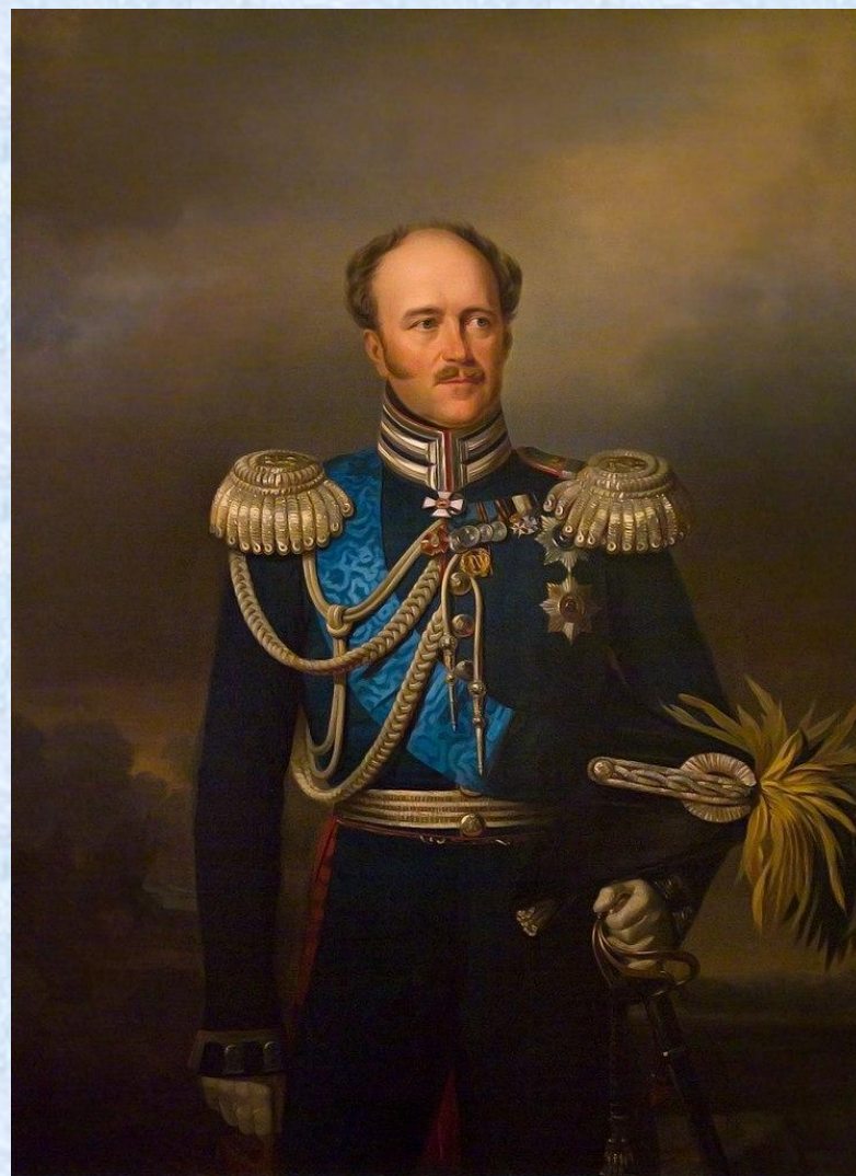
А. Х. Бенкендорф, глава III Отделения Тайной канцелярии