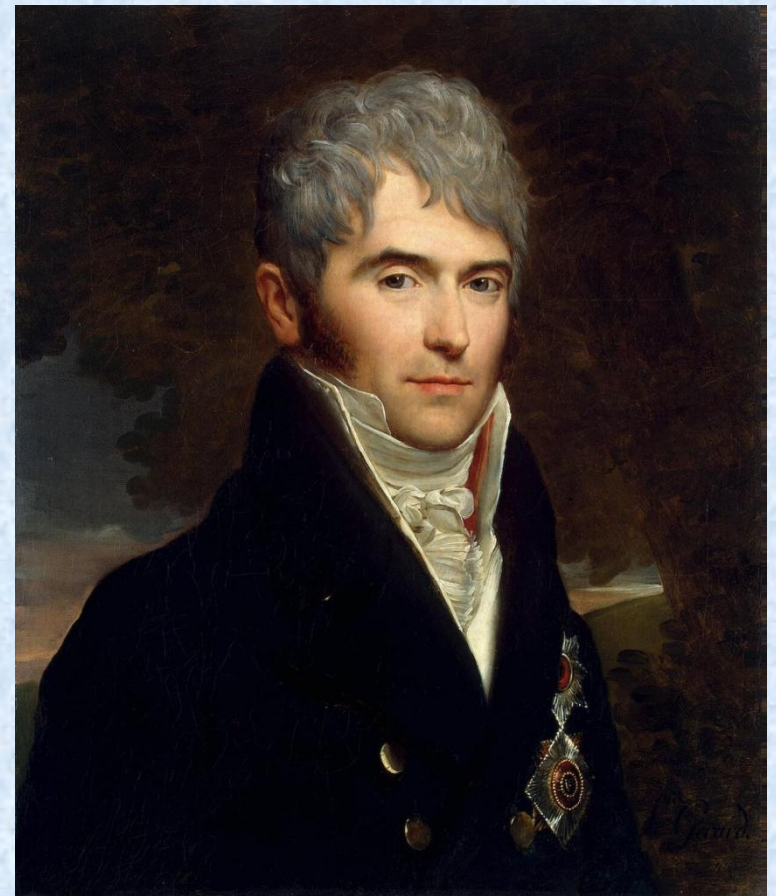
Виктор Павлович Кочубей — русский государственный деятель, министр внутренних дел, председатель Государственного совета и Комитета министров, канцлер Российской империи.