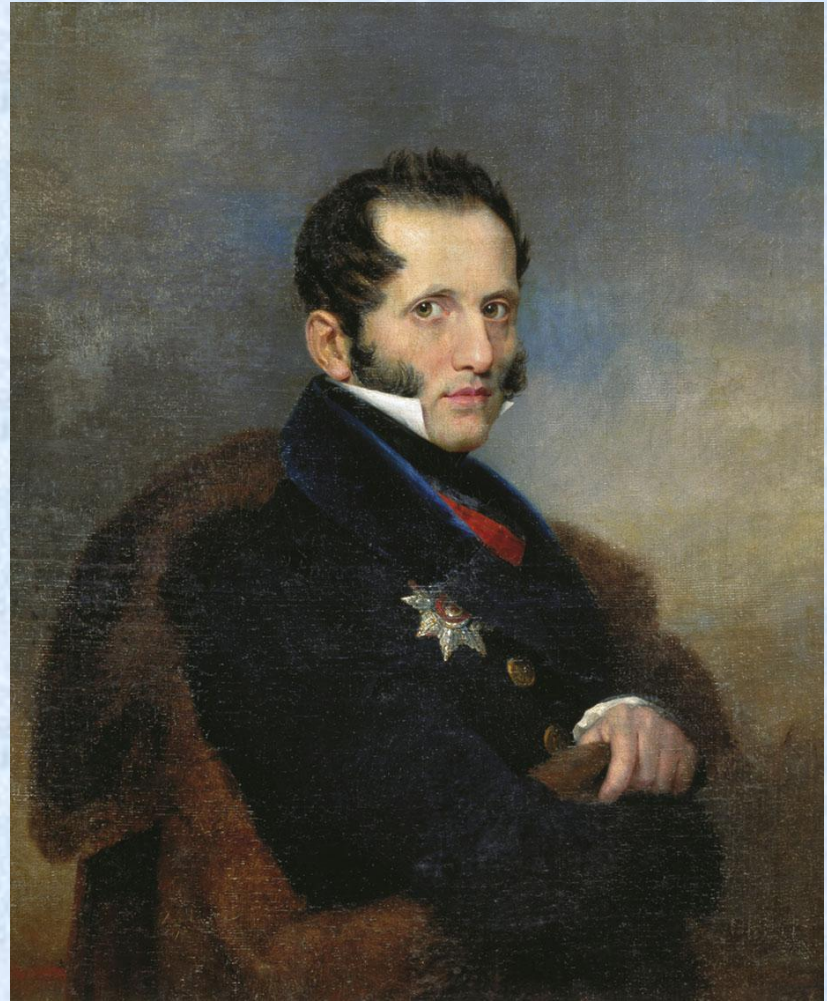
граф С. С. Уваров