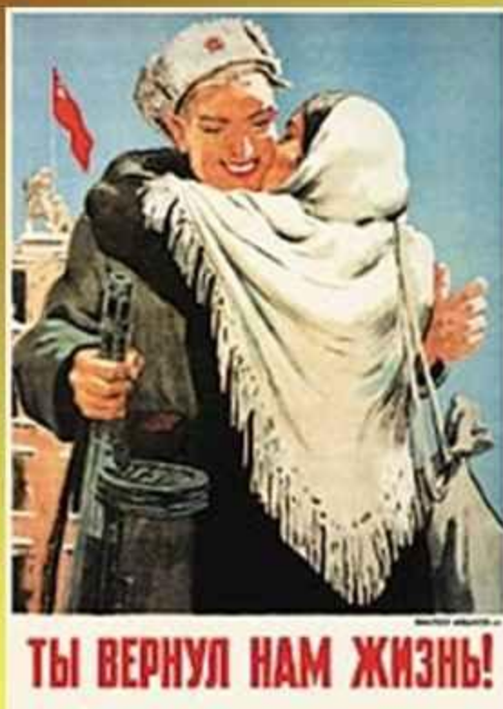
картины на военную тематику