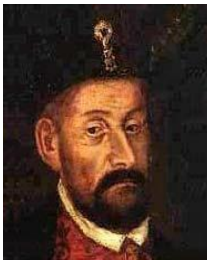
Польский король Стефан Баторий. 1576 год.