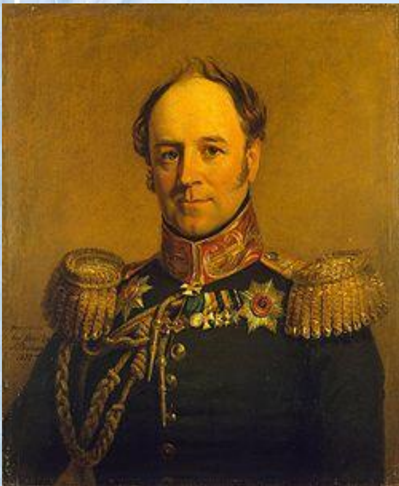
А. Х. Бенкендорф

1826 г. - создано III Отделение императорской канцелярии.