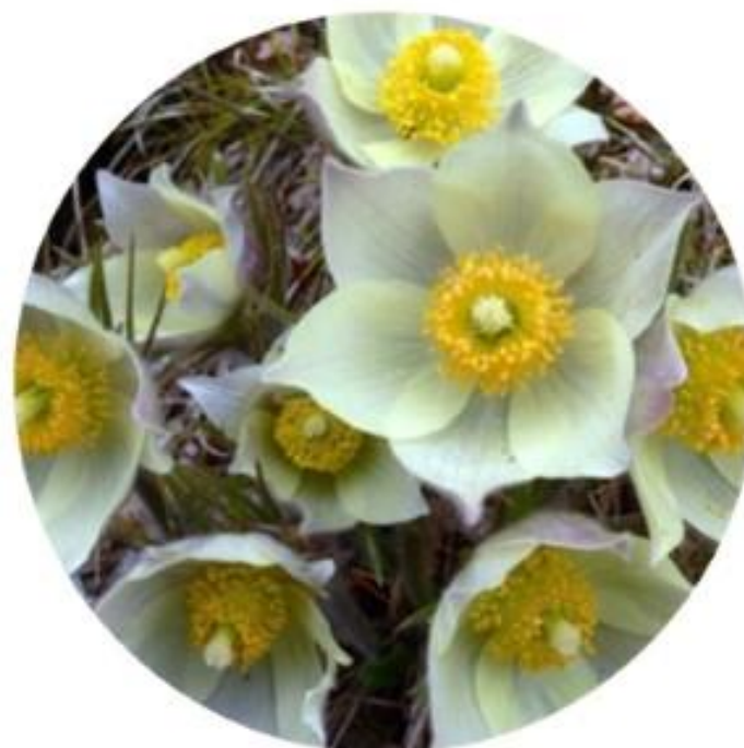
Прострел уральский. Уральский округ