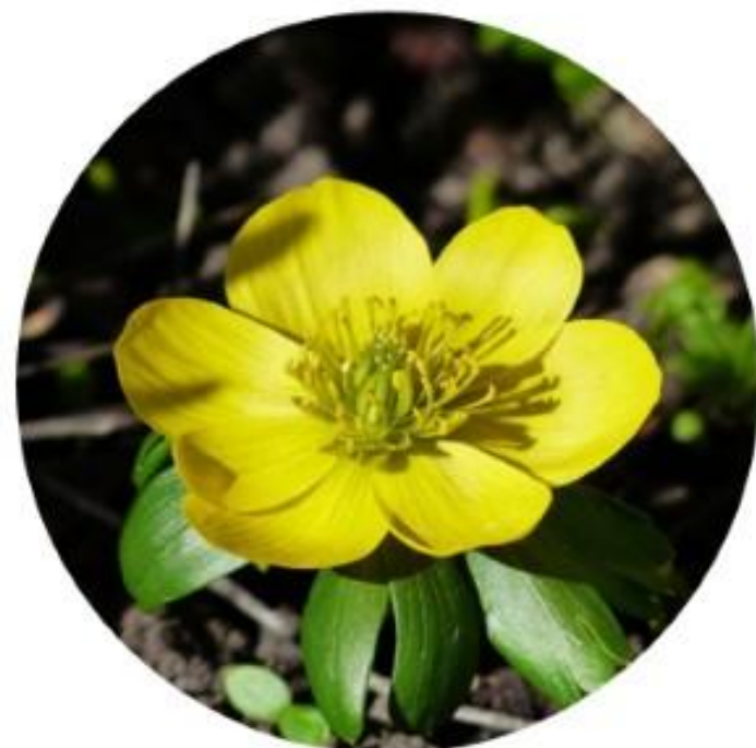
Адонис Амурский. Дальневосточный округ