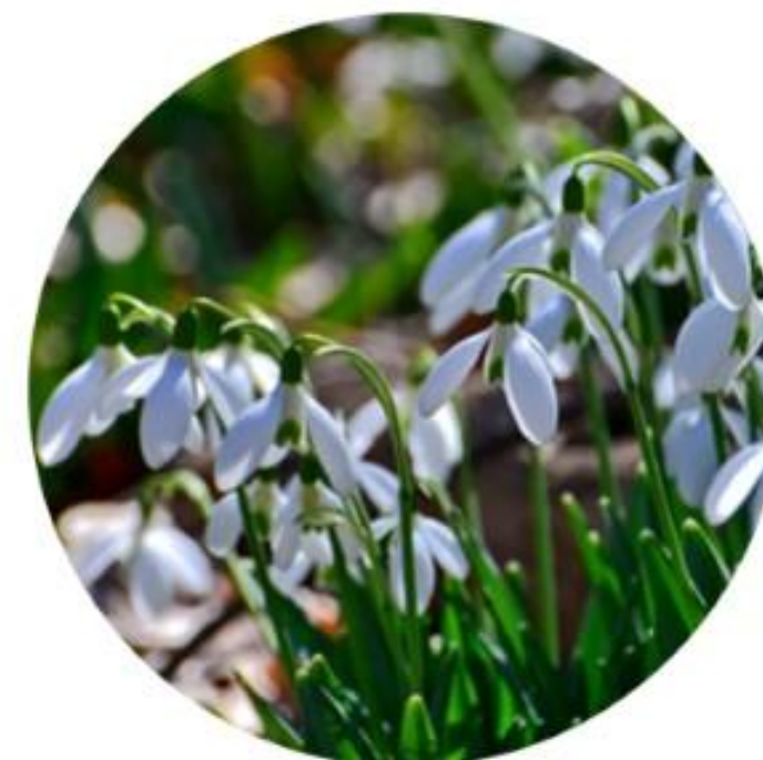
Подснежник. Южный округ