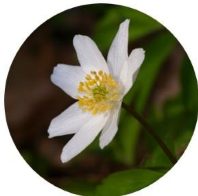
Ветреница. Северо-западный округ