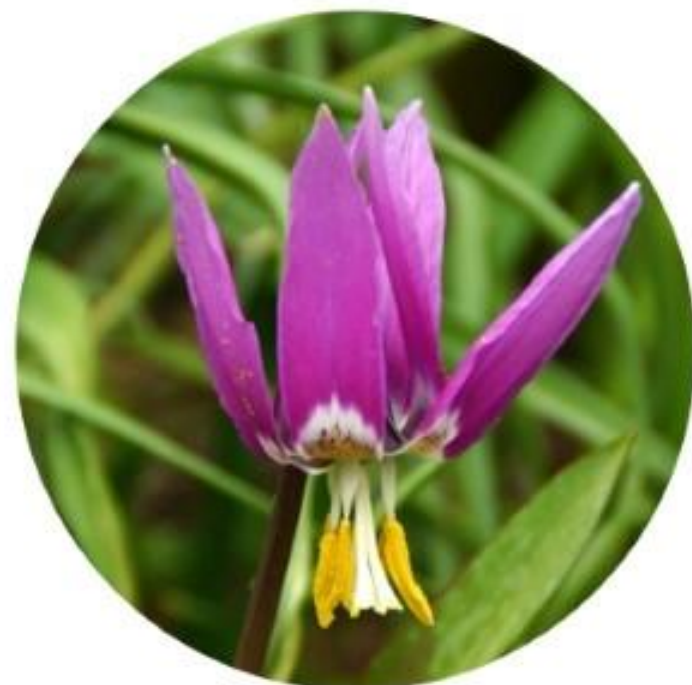
Кандык. Сибирский округ