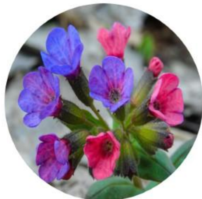
Медуница. Центральный округ