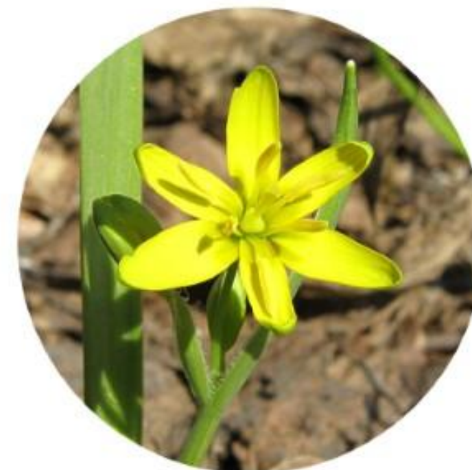
Лютик весенний. Приволжский округ