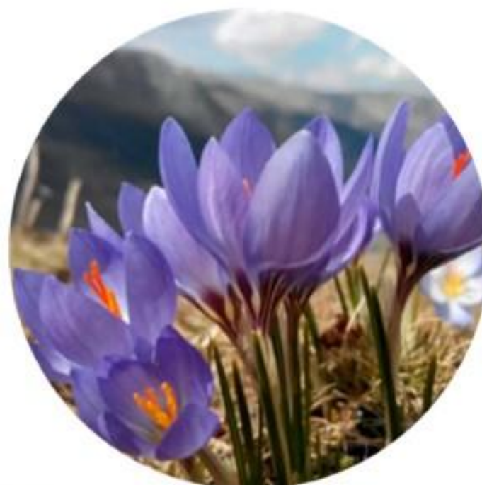
Крокус. Северо-кавказский округ